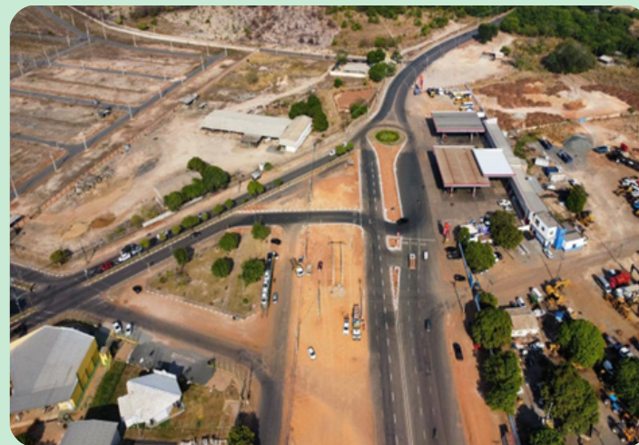
Convênio nº 896928/2019 - Ampliação e Duplicação de Rodovia Estadual - Boa Vista/RR.