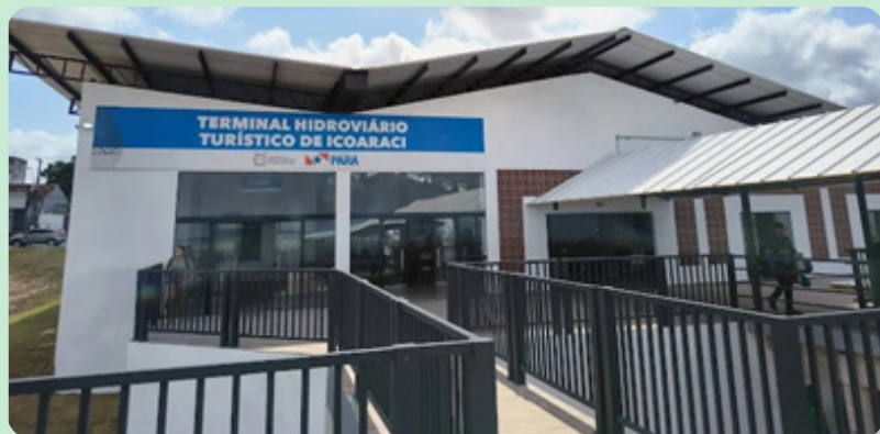
Convênio nº 911133/2021 Construção do Terminal Hidroviário Turístico de Icoaraci – Belém/PA.

Funcional Programática: 10.53202.15.244.2317.OOSX