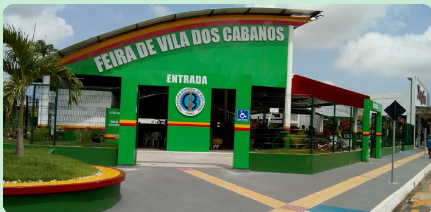
Convênio nº 828178/2016 – Construção de Feira Coberta – Barcarena/PA.

Funcional Programática: 10.53202.20.608.2317.214S