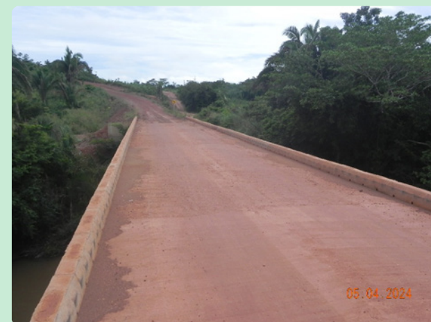
Convênio nº 867909/2018 - Construção de Ponte - Santa Maria do Tocantins/TO