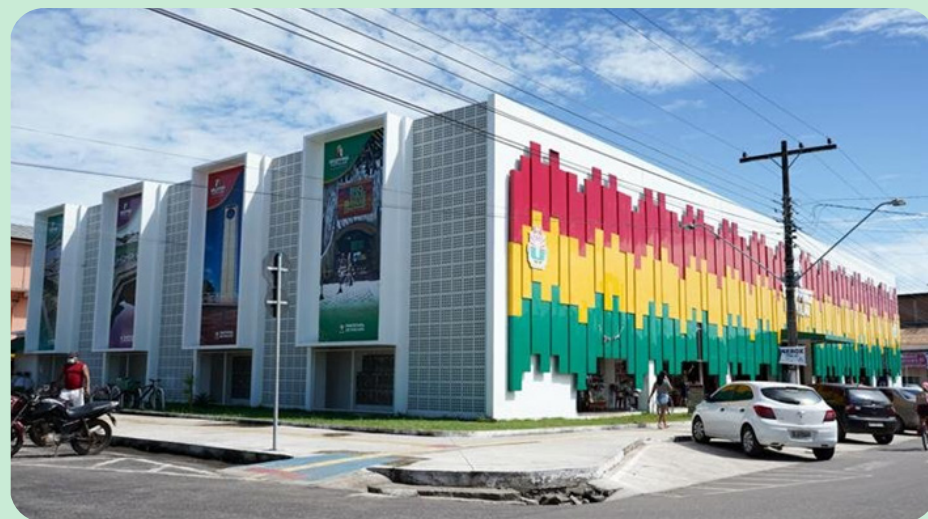
Convênio nº 894191/2020 – Construção de Shopping Popular (Feira) – Macapá/AP.