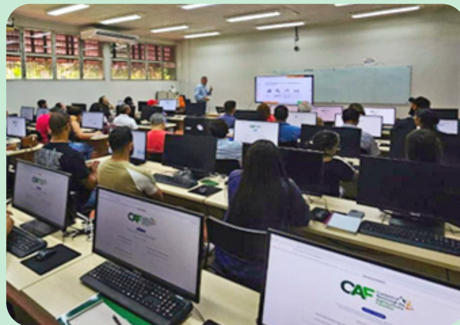
Oficina sobre o novo Cadastro da Agricultura Familiar (CAF) 3.0 – Rio Branco/AC.