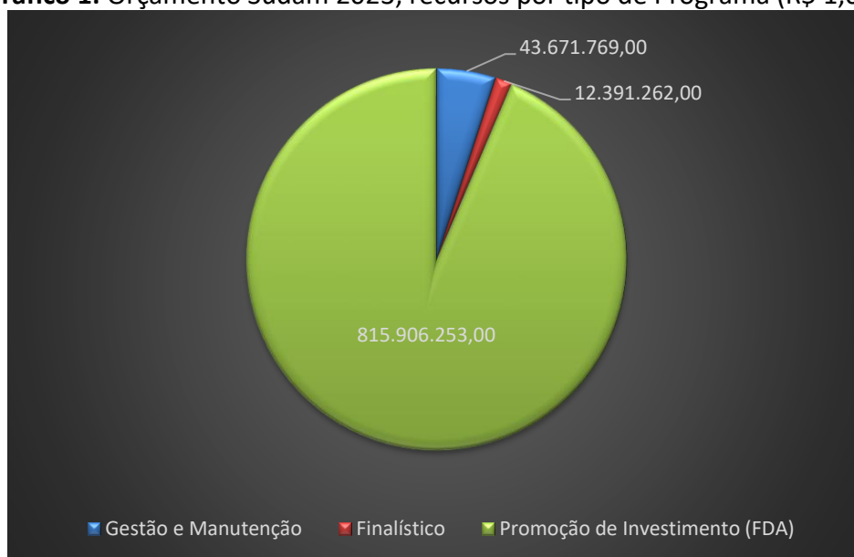
Gráfico 1: Orçamento Sudam 2023, recursos por tipo de Programa (R$ 1,00).