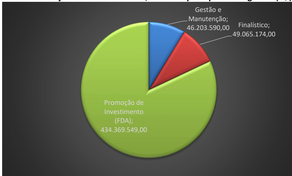
Gráfico 1: Orçamento Sudam 2022, recursos por tipo de Programa (R$)