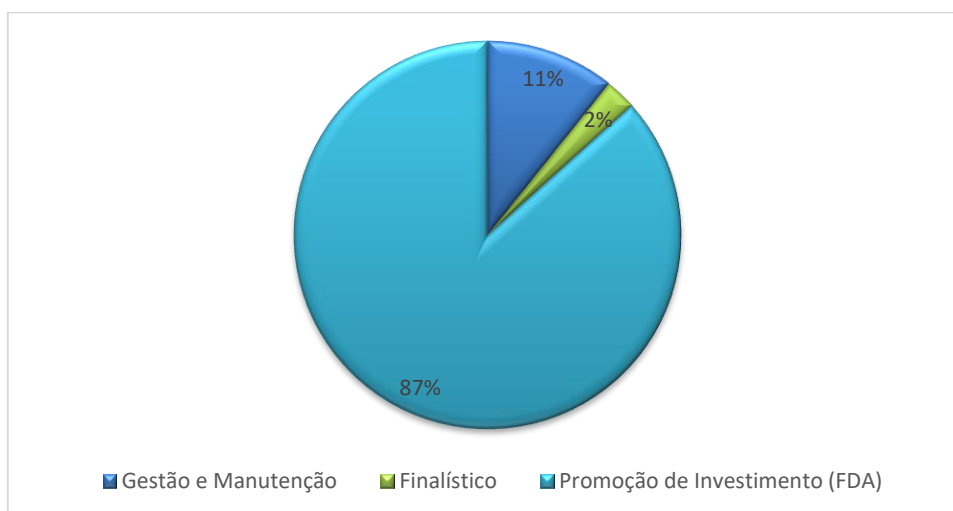
Gráfico 1: Orçamento Sudam 2021, previsão de recursos por tipo de Programa (R$ mil)