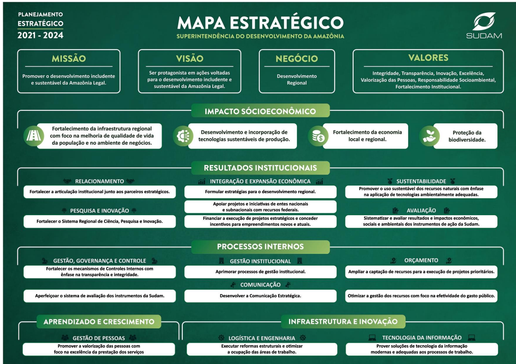
Figura 1: Mapa Estratégico da SUDAM