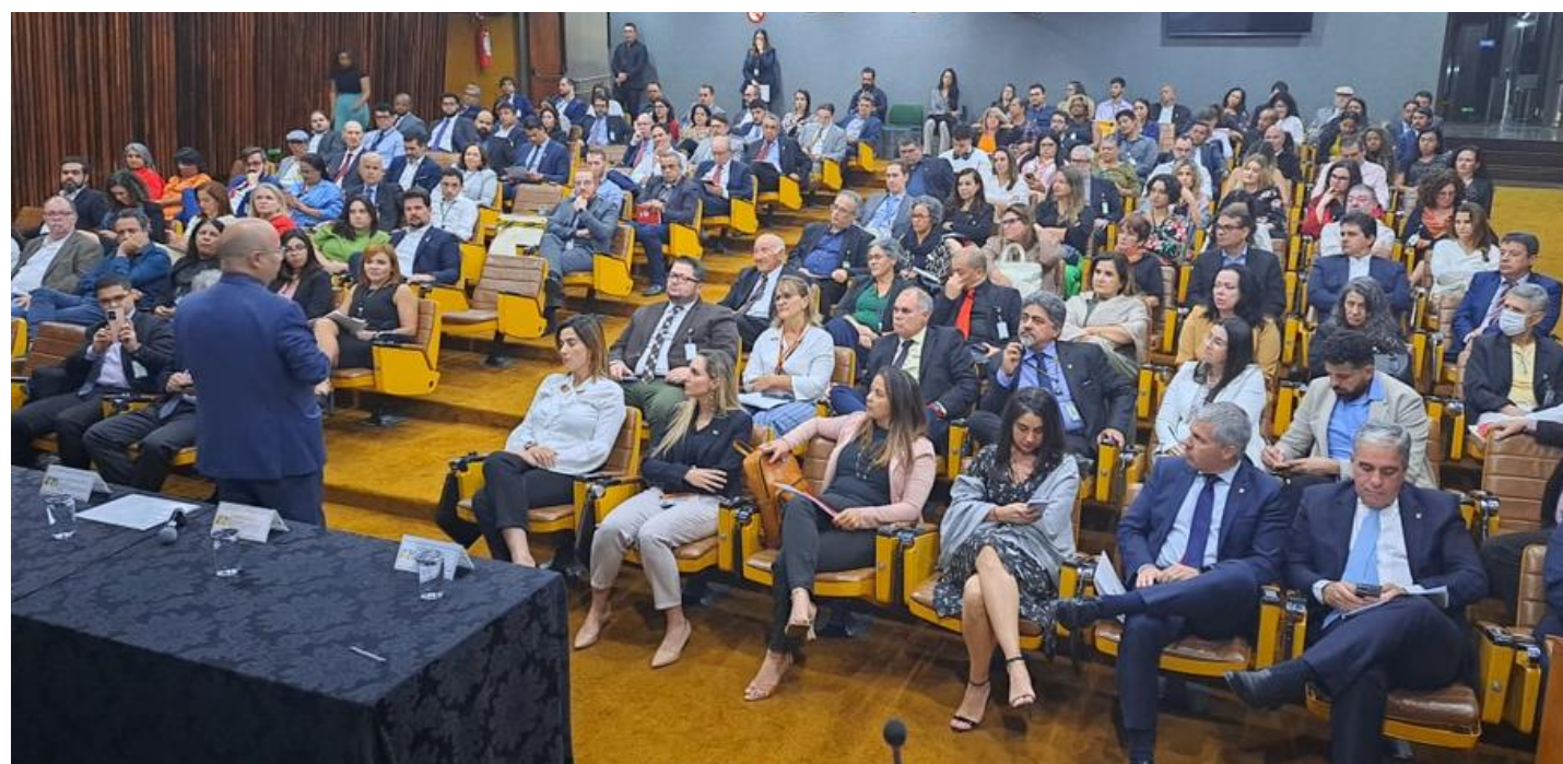
Legenda: Seminário sobre Planejamento Estratégico da Secretaria de Relações Institucionais, realizado em 13 de julho de 2023.

Propostas de Missão, Visão e Valores foram apresentadas aos dirigentes e colaboradoras (es) da SRI e todas (os) tiveram a oportunidade de apresentar suas preferências e sugestões de ajuste. Os resultados dessa pesquisa foram compilados, apresentados e aprovados pela alta administração em julho de 2023.