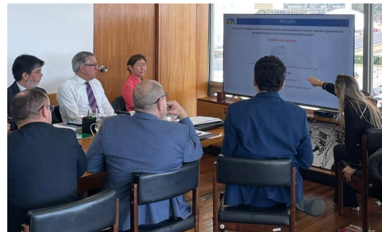
Legenda: Aprovação da Missão, Visão e Valores da SRI pela alta administração.

Democracia, diálogo, colaboração, integridade e governabilidade.