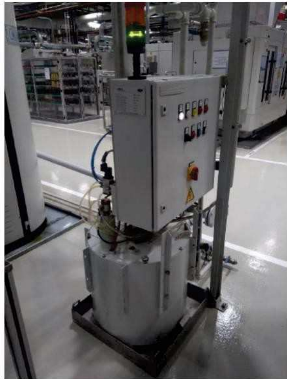
Coolant high pressure system