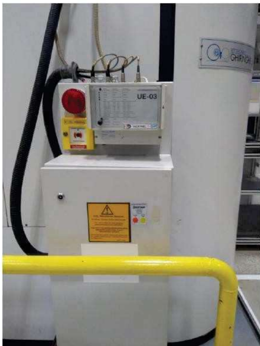
Fire Extinguishing System