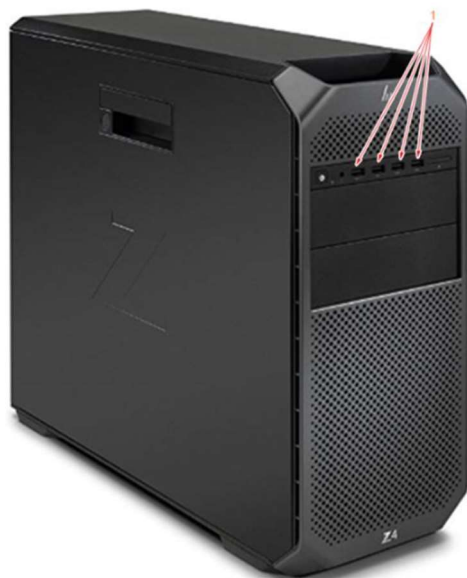
Figure 1. Z4G4 Front Panel