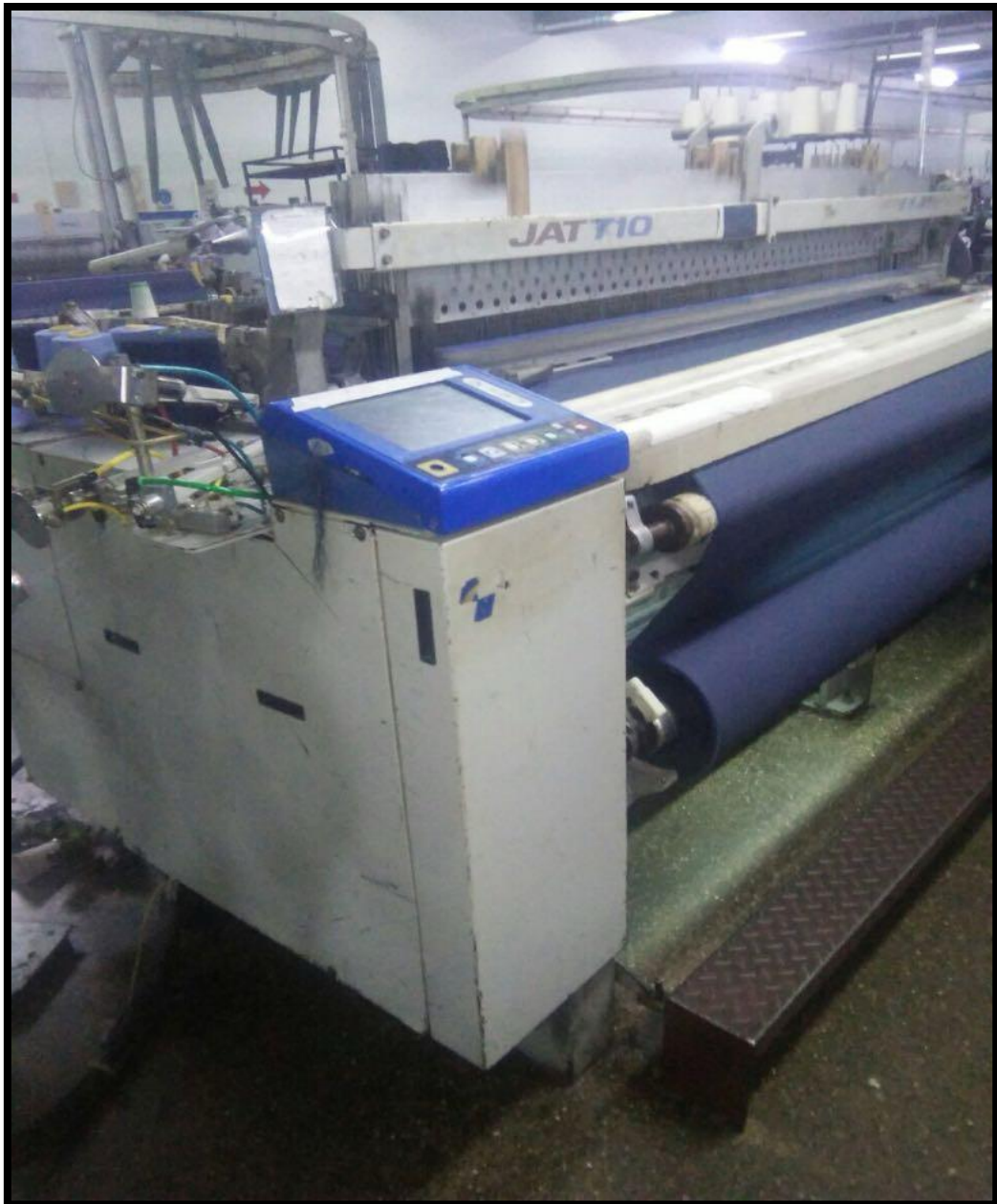
Foto 02 - Vista detalhada do tear retilíneo a jato de ar