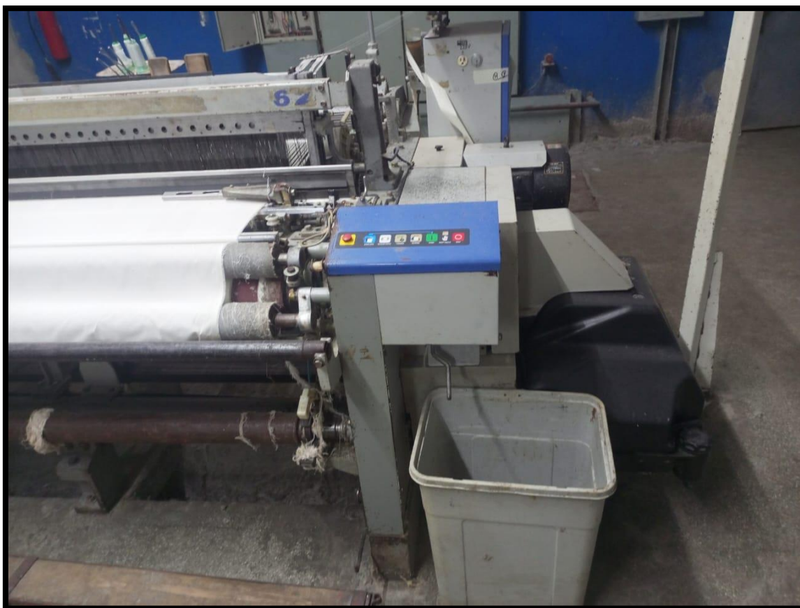
Foto 01 - Vista detalhada do tear retilíneo a jato de ar