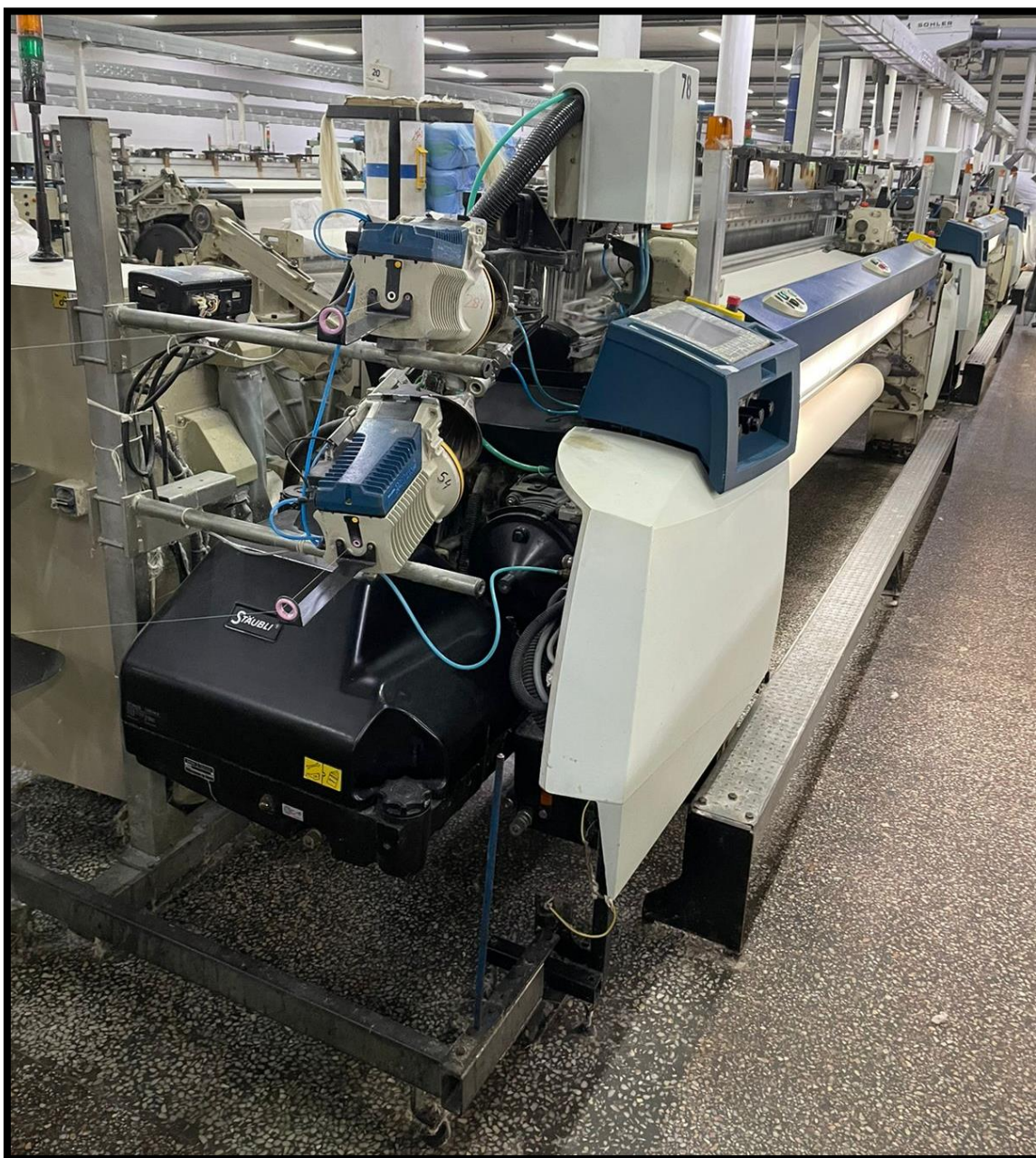
Foto 01 - Vista geral dos teares retilíneos a jato de ar