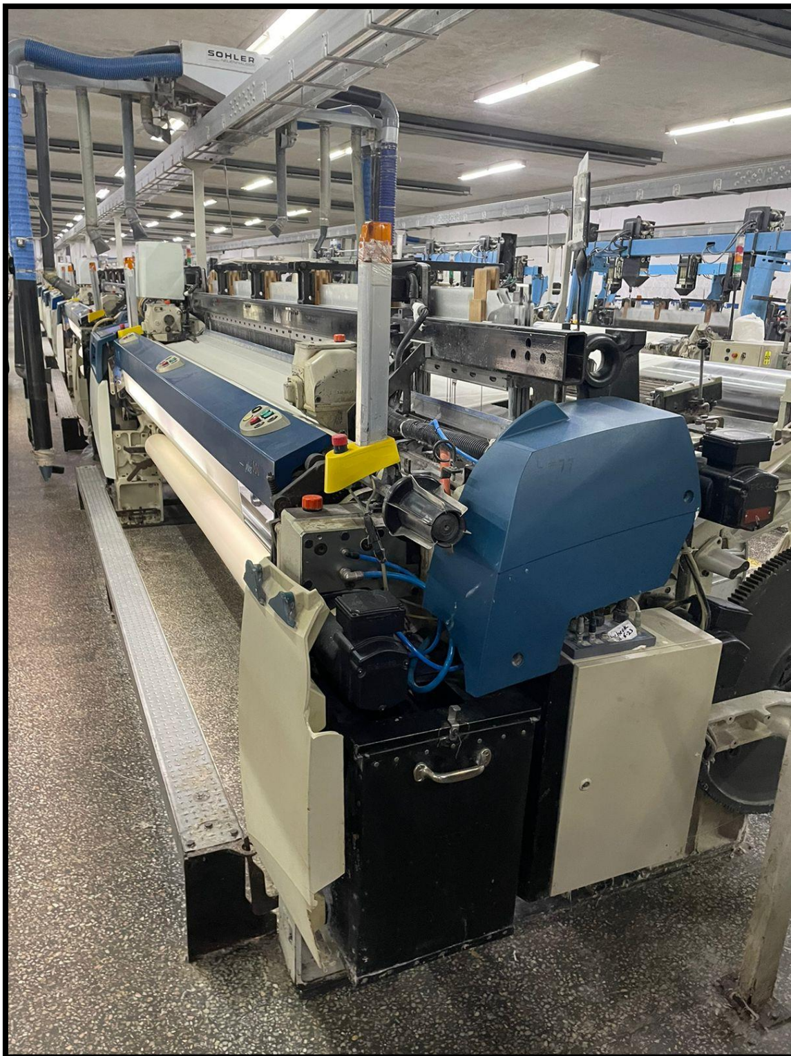
Foto 02 - Vista geral dos teares retilíneos a jato de ar