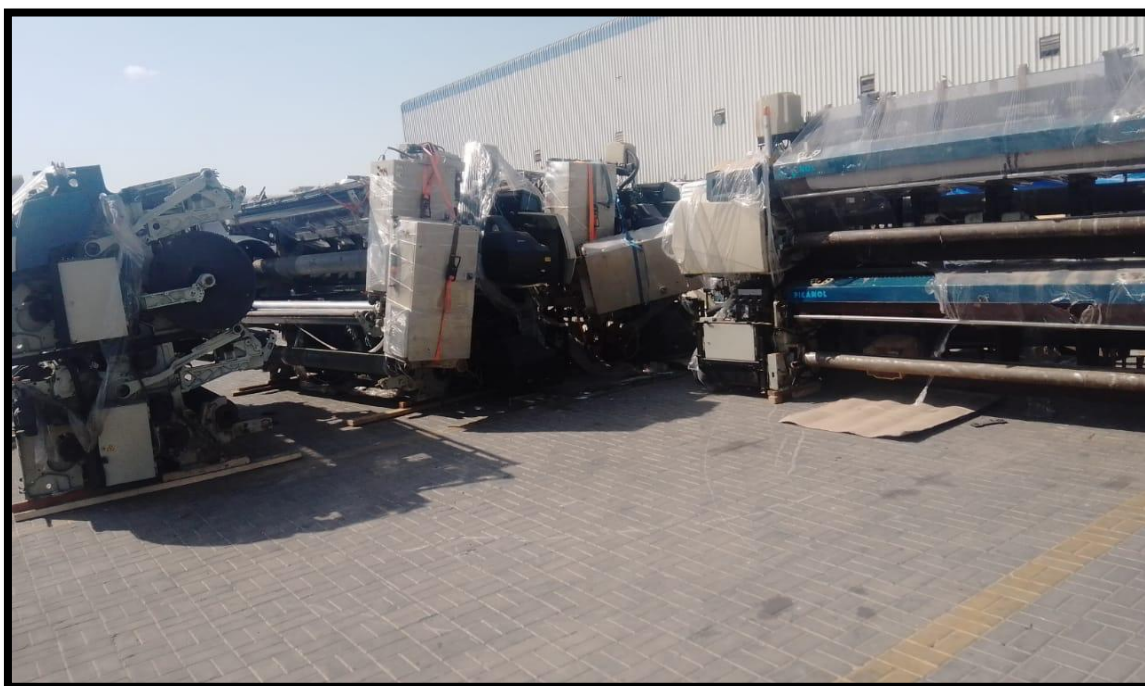
Foto 01 - Vista geral dos teares retilíneos a jato de ar