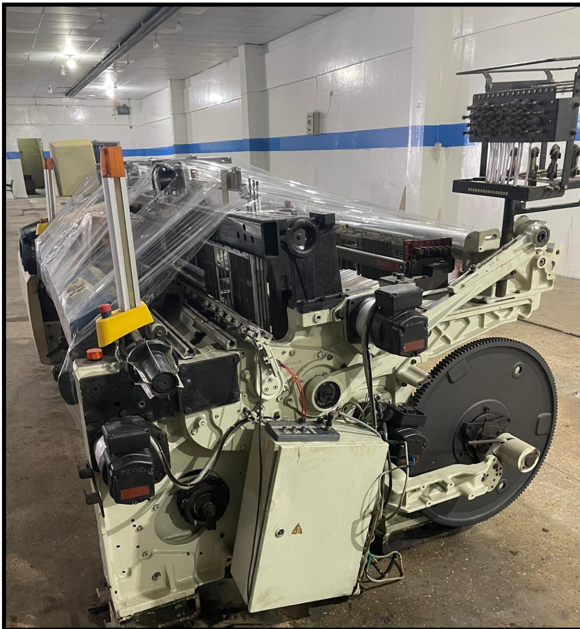
Foto 02 - Vista geral do tear retilíneo a jato de ar