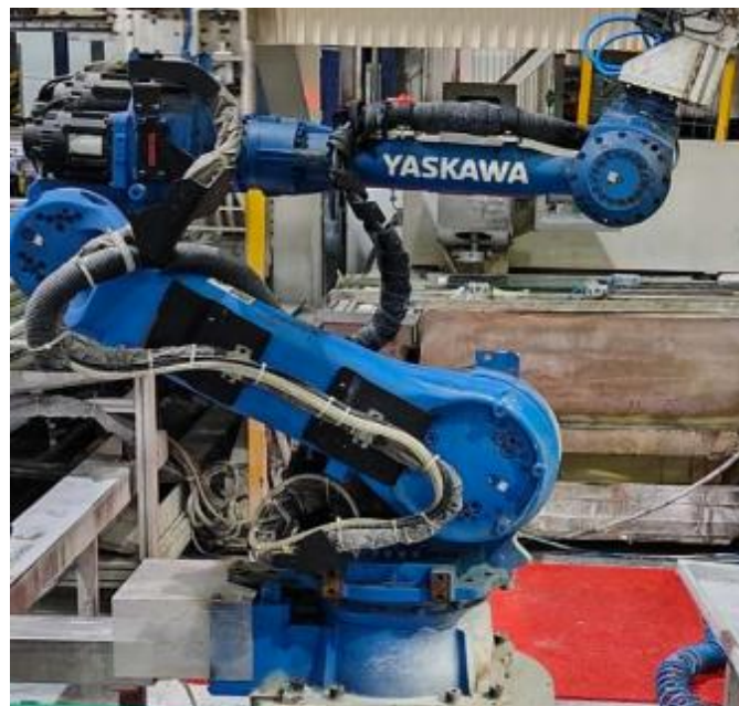
Fig.4 – Foto do equipamento