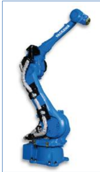
Fig.1 – Foto do equipamento