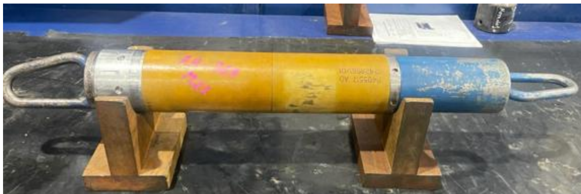
Figura 1: Imagem do AH-369-A