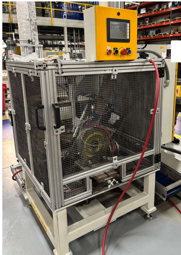
Imagem máquina de serra (lateral direita) e esteira na lateral