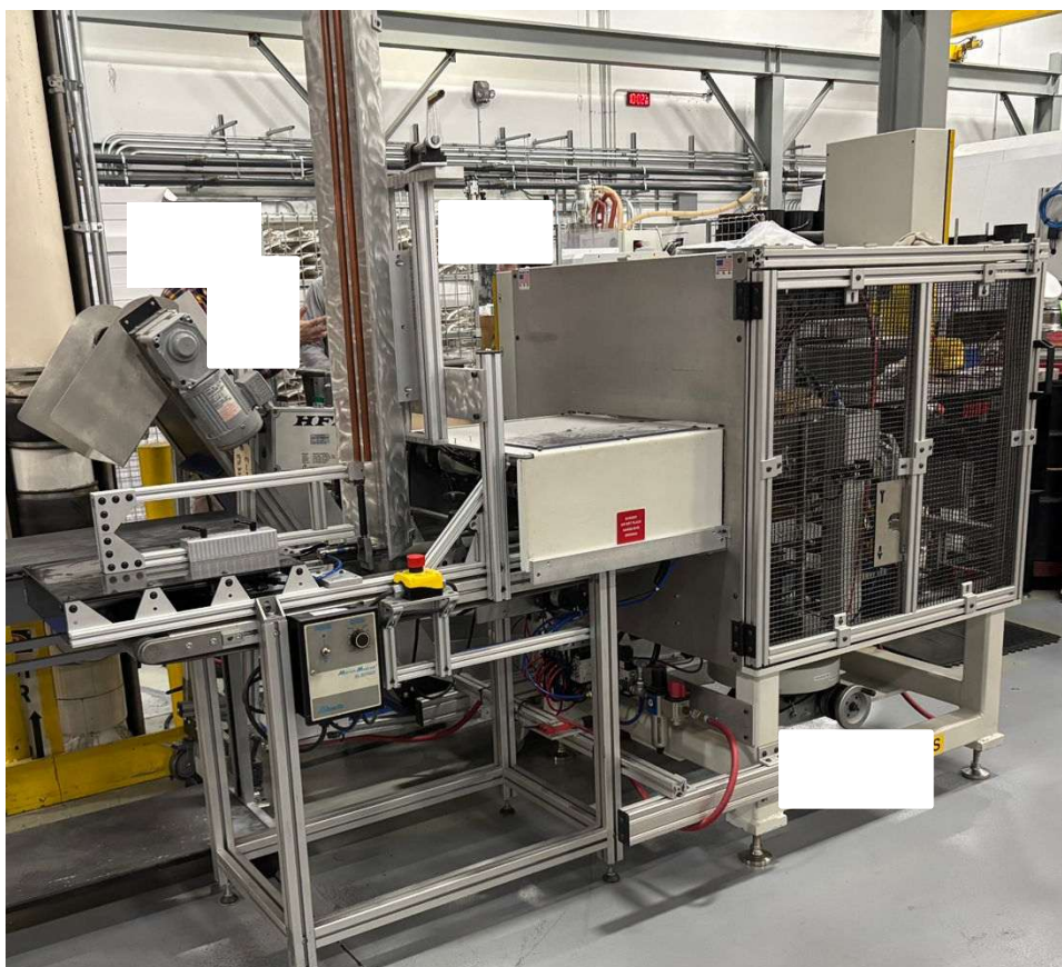
Imagem máquina de serra (frente)

Máquina de serra circular, marca Effective Production Solutions INC., modelo T-cutter