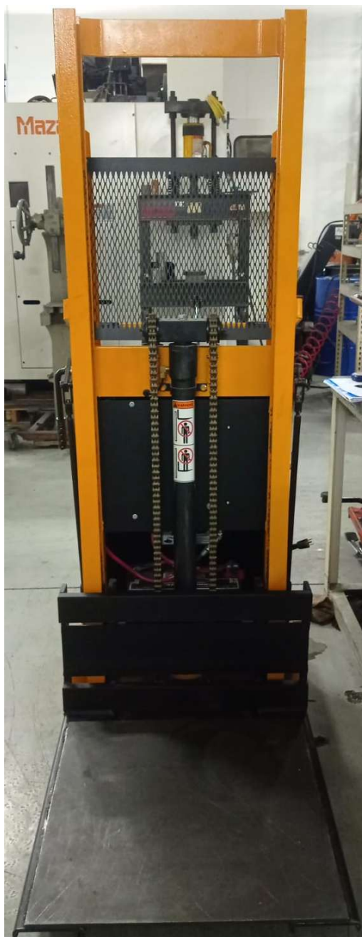
Imagem empilhadeira elétrica (frente)

Empilhadeira elétrica a bateria, marca Big Joe, modelo 2018-R5