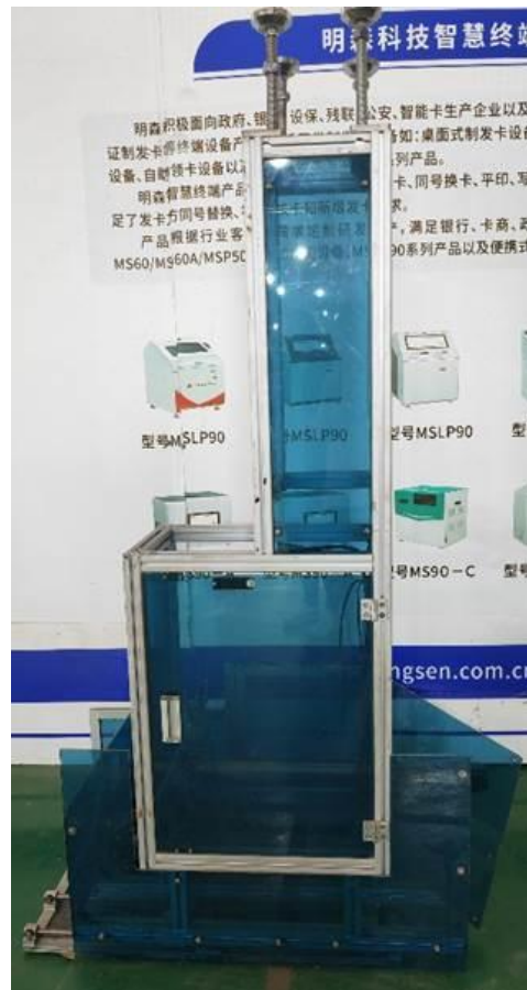
Figura 1 - Vista lateral