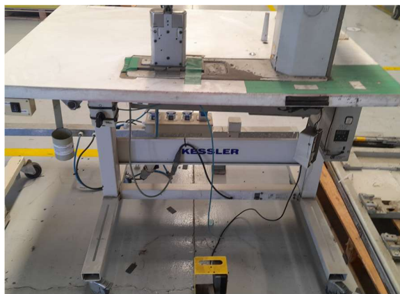
Imagem 3 – Mesa de Trabalho Ergonômica