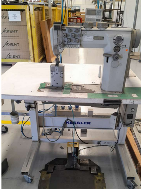
Imagem 1 - Máquina de Costura modelo 0868 - Durkopp Adler