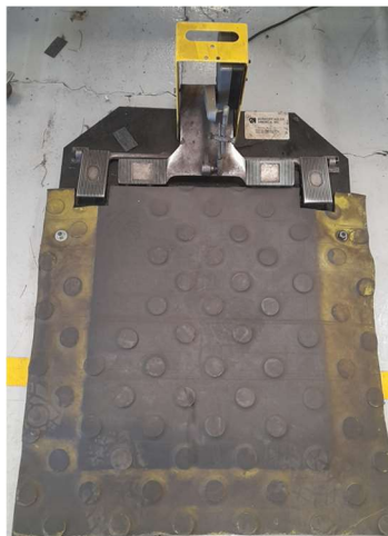
Imagem 4 – Pedal de acionamento