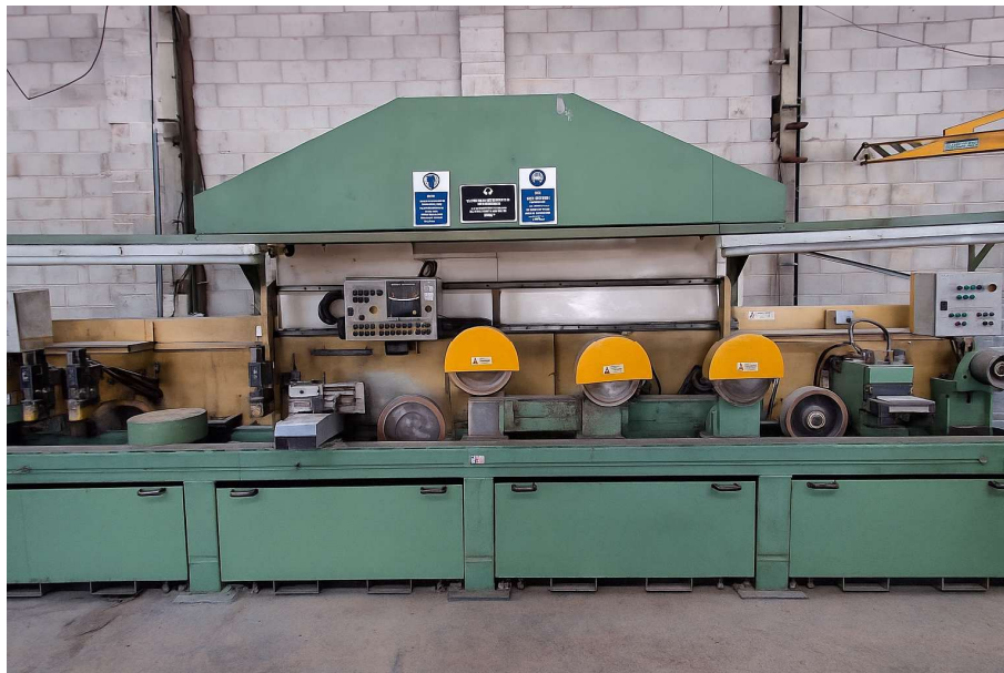
Figura 1 - Vista frontal da máquina

Durante o processo há o aquecimento da ferramenta na região onde há o contato com o material, como o material normalmente é oleado em processos anteriores, esse óleo em contato com a ferramenta aquecida acaba gerando fumaça ou vapores indesejados, sendo assim a máquina possui um sistema exaustão para remover essa fumaça ou vapores do ambiente de trabalho.