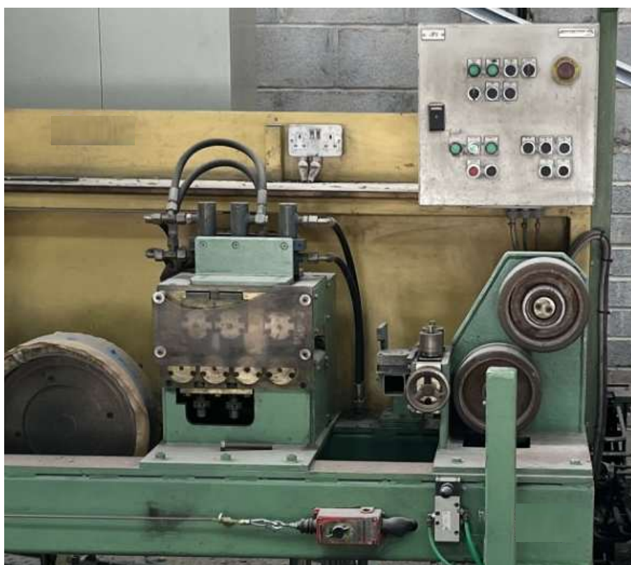
Figura 3-Vista frontal do sistema de rolo S e Calandra