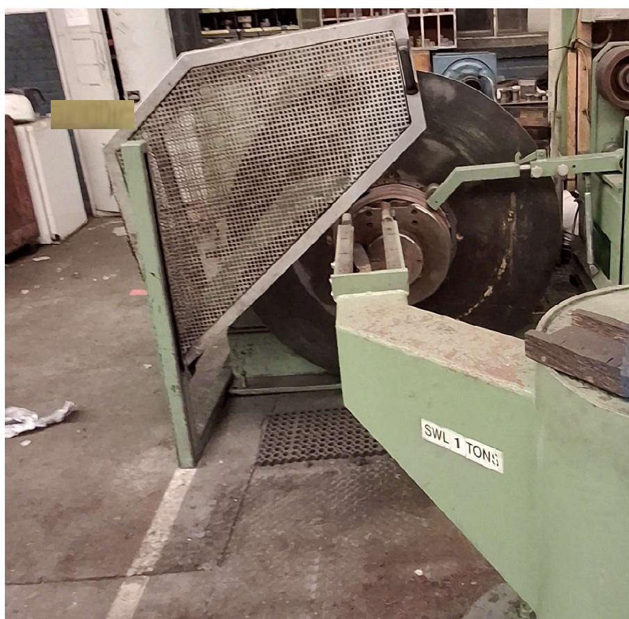
Figura 5-Vista frontal do bobinador para rolos de até 1t.