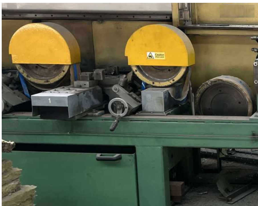
Figura 4- Cabeçote de usinagem + Guias centralizadora + rolos tensionadores