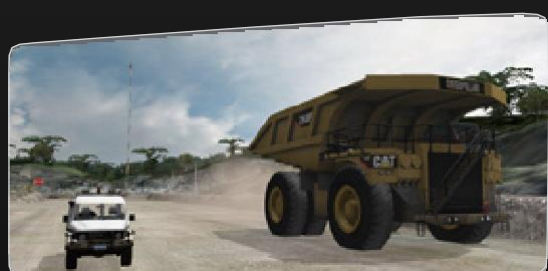
Cenários de condução Procedimentos