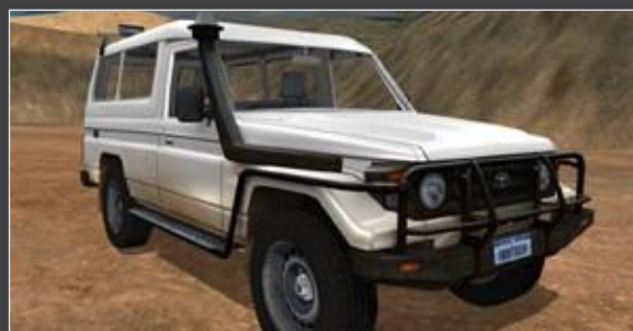
Características operacionais baseadas no Landcruiser '78 Series Light Vehicle

Com a capacidade de medir, avaliar e aprimorar com precisão os níveis de habilidade de um operador, o Simulador de Equipamento Avançado pode melhorar a segurança e a lucratividade em seu local.