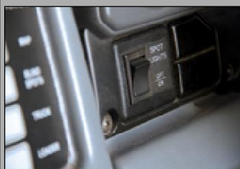
Luz de farol simulada