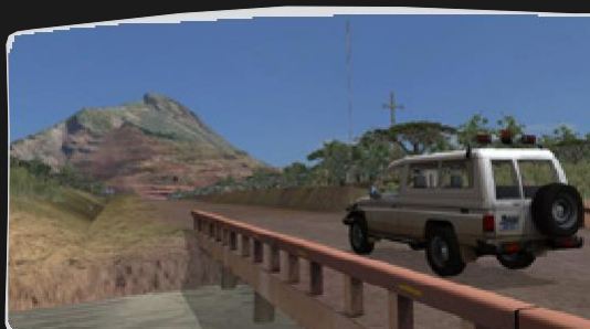
Específicos do Site