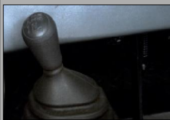
Seletor de tração nas quatro rodas