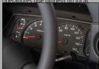
Instrumentação totalmente funcional e painéis de exibição

O Kit de Conversão de Veículos Leves desempenhará um papel fundamental na abordagem dos requisitos de saúde e segurança ocupacional enfrentados pelas empresas globais de mineração para os operadores que dirigem no local.