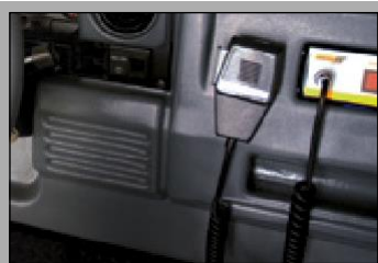
Módulo de rádio simulado