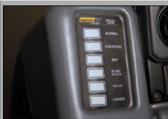
Interruptores de visualização especiais