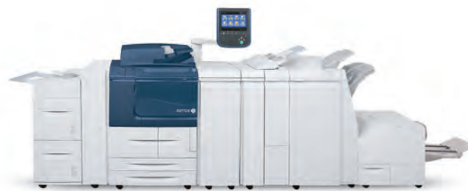
Copiador/Impressora Xerox® D136 apresentado com Alimentador de alta capacidade com 2 bandejas, Finalizador Standard, Módulo de Dobragem e Inserir Pós Processamento.