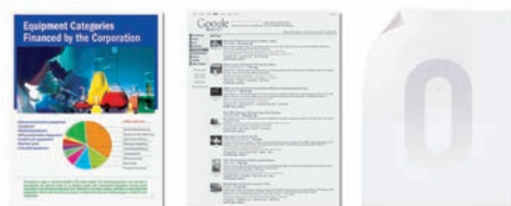
Impressão em Cores de Alta Definição

Color Access Policy Manager (CAPM) Permite controlar e monitorar o uso de cor ao definir quem pode imprimir e o que será impresso. Decida quem e o que pode ser impresso em cores, em preto e branco ou que não possa imprimir nada, tornando a relação custo/benefício da impressão em cores a melhor. Políticas de segurança podem ser atribuídas por nome de usuário, nome do computador/servidor, aplicativo, nome de arquivo e web sites. Uma vez que as políticas forem configuradas, o CAPM