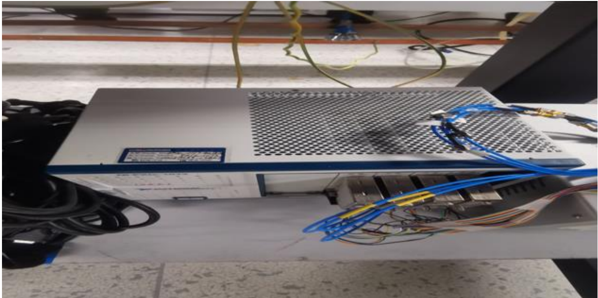
Figura 1: Foto do equipamento.