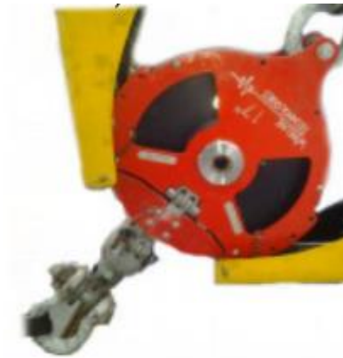
Figura 2: SHVC com kit de segurança instalado