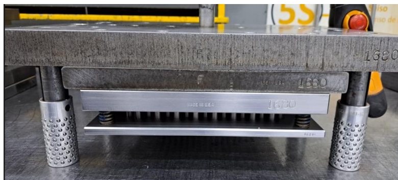
Figura 1: Placa de Montagem Superior - Vista Frontal

As imagens a seguir detalham as placas de montagem que compõem a ferramenta de corte: