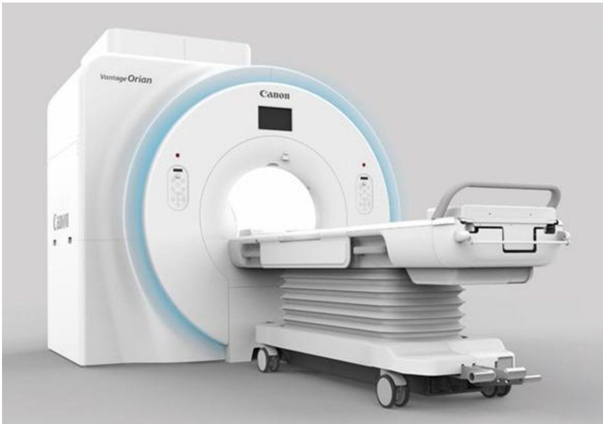
Vantage Orian 1.5 T