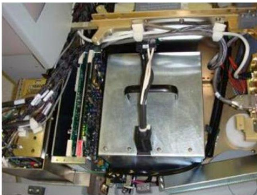
Foto 2: Bateria instalada dentro do base eletrônica do carro dos braços.