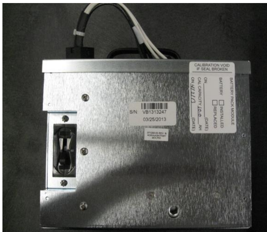
Foto 3: Modulo de bateria, para o carro dos braços – PSC, do sistema robótico daVinci IS2000.