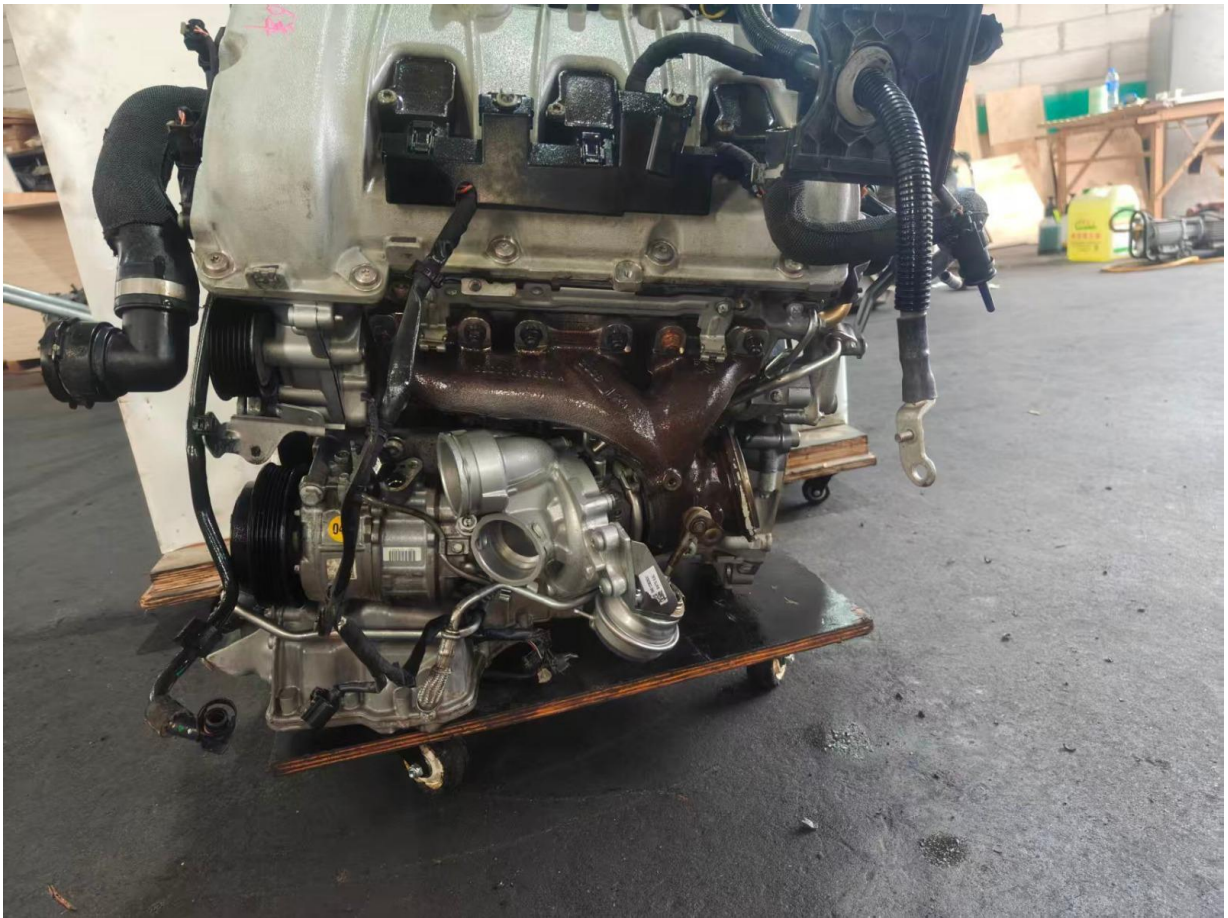
Figura 5: Vista lateral esquerda – sistema de arrefecimento, bomba d'água e tubulações