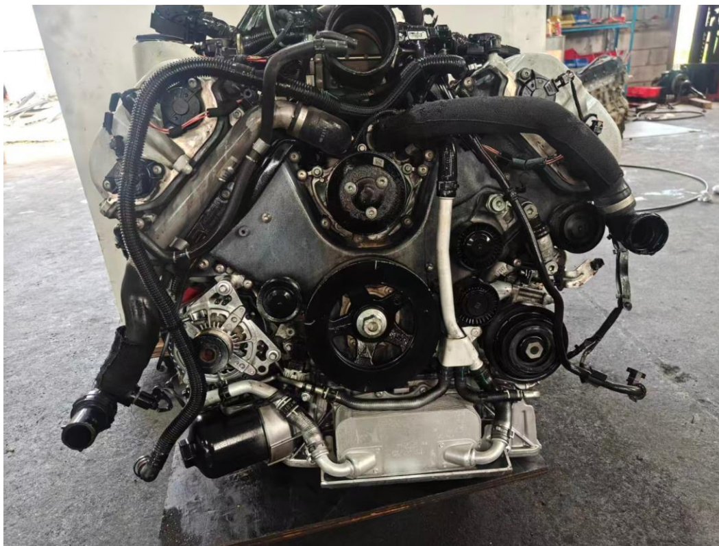
Figura 1: Vista frontal do conjunto motor – face de acionamento dos acessórios

Imagens do motor remanufaturado para documentação técnica e controle de qualidade: