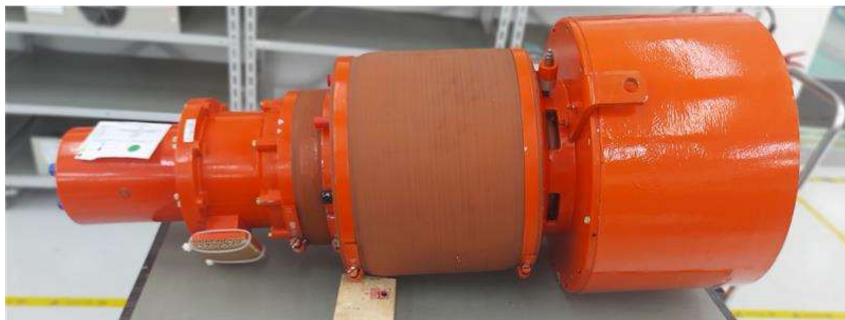
Figura 1 – VISÃO GERAL

Por outro lado, o azimuth da junta é determinado através de codificadores ópticos (em redundância eletrônica), montados no final do eixo giratório da junta. A resolução esperada é de cerca de 14 bits. A precisão do conjunto encoder - rotary é de 1 bit.