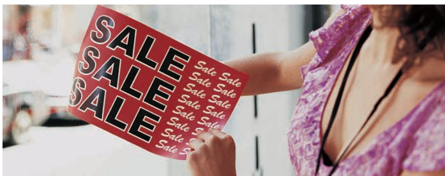
Sinalética para Janelas Xerox® NeverTear

O nosso Toner especial EA de fusão a baixa temperatura especial para poliéster, realiza a fusão em poliéster usando um método químico de fusão proprietário que assegura uma superior qualidade de imagem em substratos especiais incluindo poliéster e outros. O nosso Toner EA, incluindo Premium NeverTear é resistente à água, óleo, gordura e rasgões.