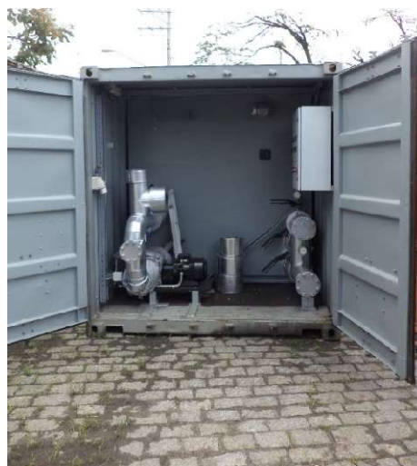
Queimador a óleo diesel