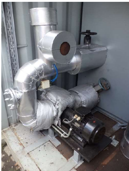
Queimador a óleo diesel