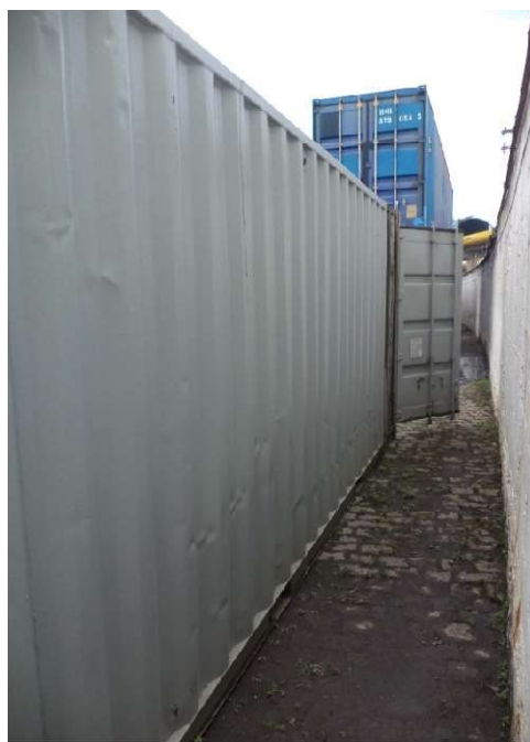
Queimador a óleo diesel