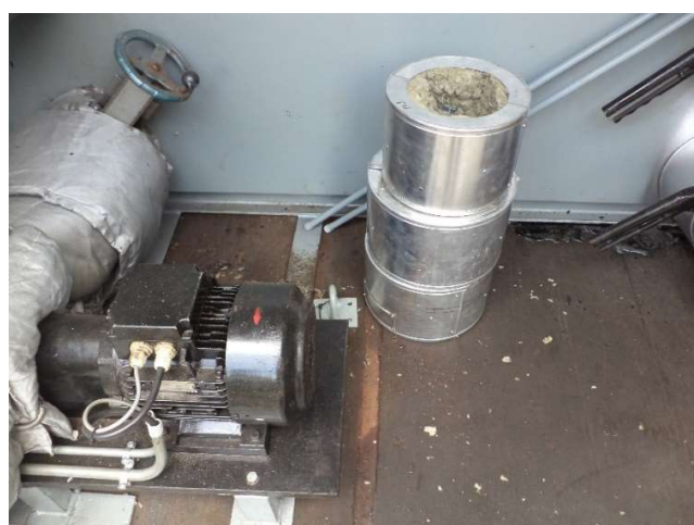
Queimador a óleo diesel