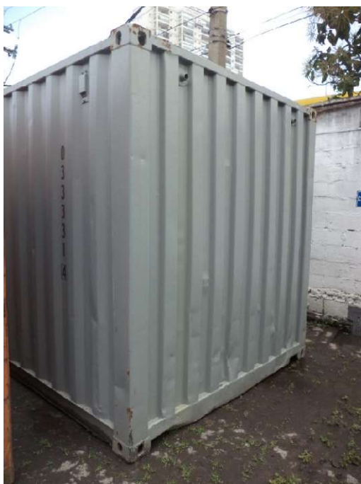
Queimador a óleo diesel