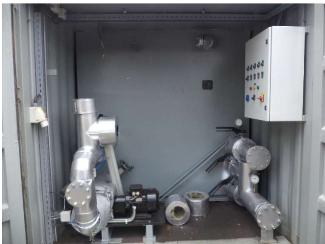
Queimador a óleo diesel