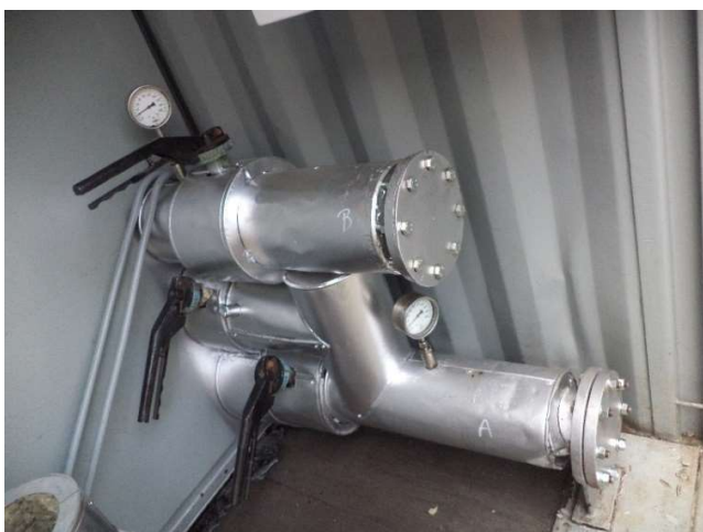
Queimador a óleo diesel