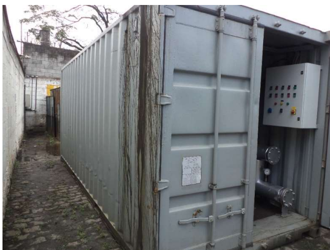
Queimador a óleo diesel