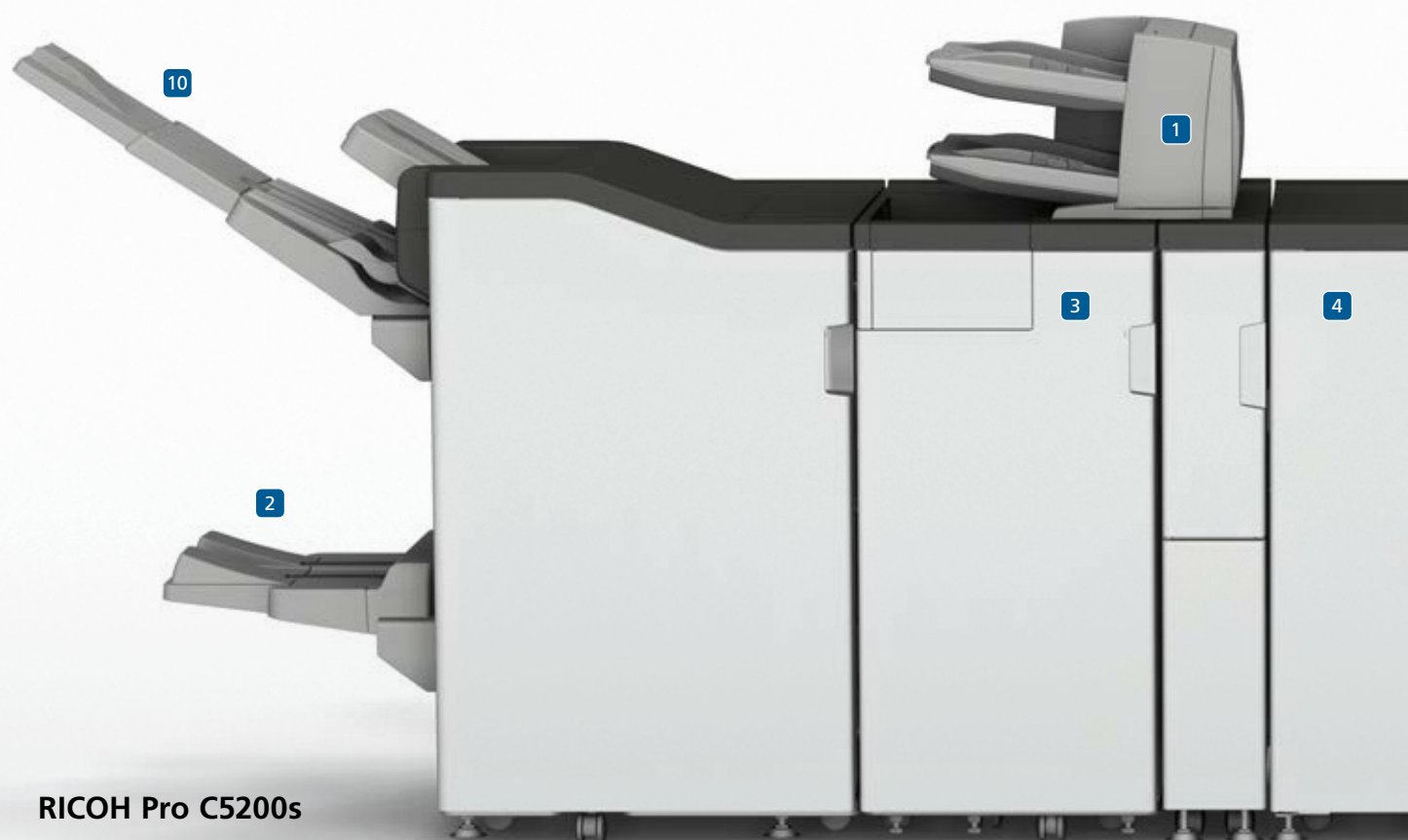
RICOH Pro C5200s