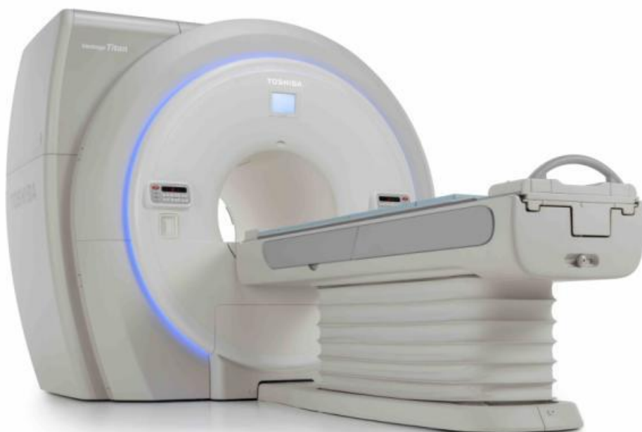
Vantage Titan 1.5T