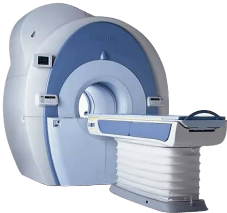
Excelart Vantage 1.5T