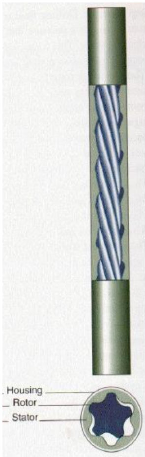
Figura 1 – Diagrama de um Motor de Perfuração e seus módulos

Aplicação – Motor de perfuração de poços, de deslocamento positivo. Sua principal função é direcionar a perfuração, através de ajustes de ângulo feito na superfície da plataforma de acordo com o plano de perfuração desejado.