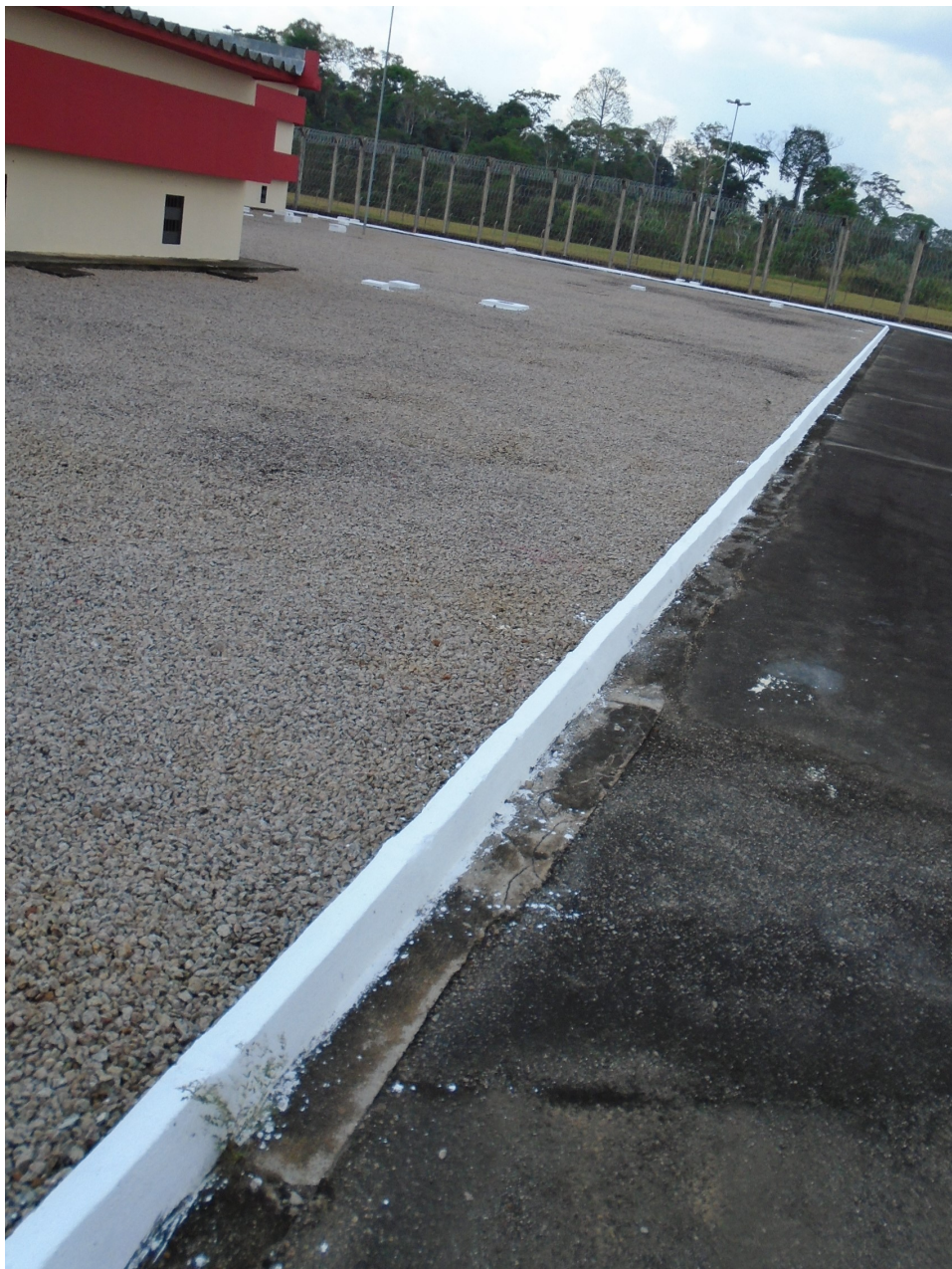
Imagem aérea da PFPV