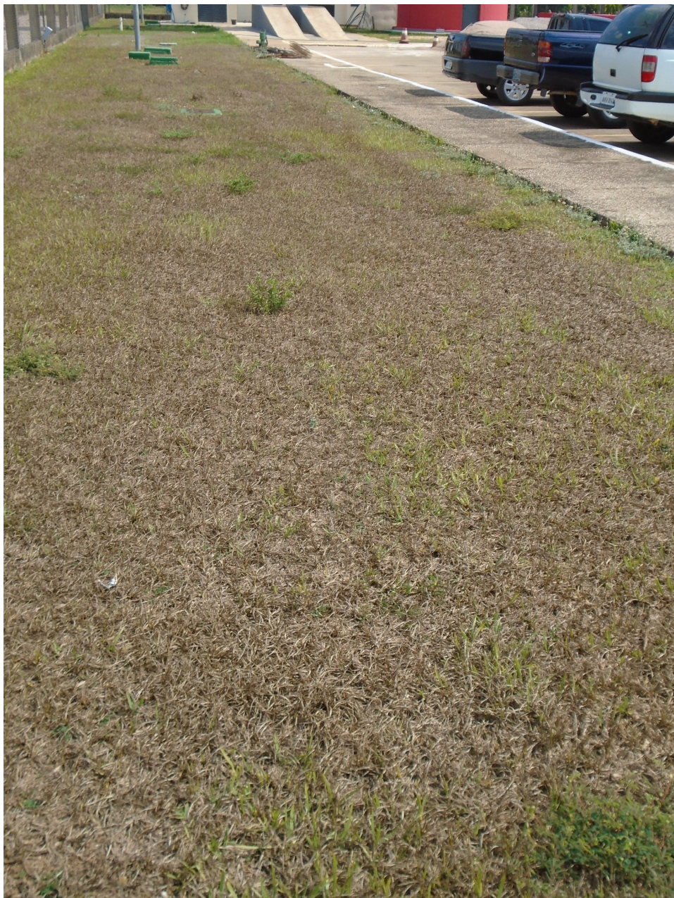
Área de Brita interna