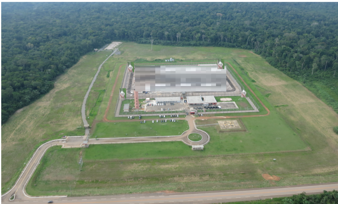
Corte de Grama