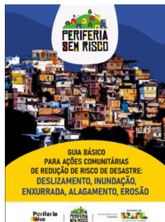
Cartilhas: ações comunitárias e lideranças

FORTALECER A COMUNICAÇÃO TERRITORIALIZADA E A FORMAÇÃO POPULAR