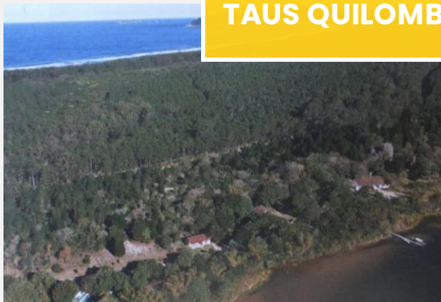
Imagem retirada da internet.