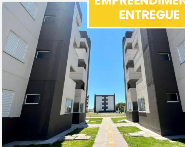
Imagem de notícia.