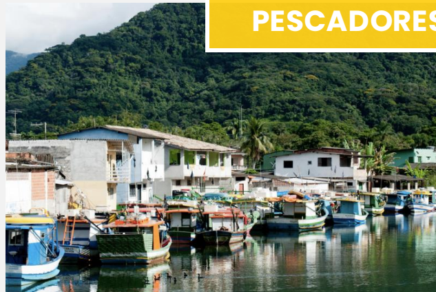
Imagem retirada da internet.