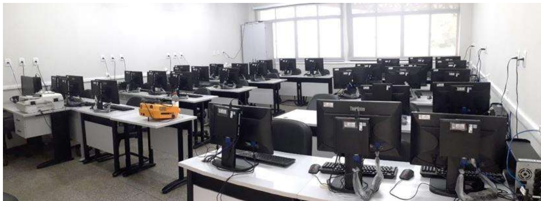
Laboratório de Informática

Dos espaços disponibilizados, apenas o laboratório de informática está equipado faltando apenas nobreaks, as salas serão mobiliadas com estação plataforma, armários, cadeiras, notebooks e computadores adquiridos com a verba de capital destinada para o projeto e com algumas mobílias disponível no campus para melhor acomodação e conforto dos alunos e equipamentos.