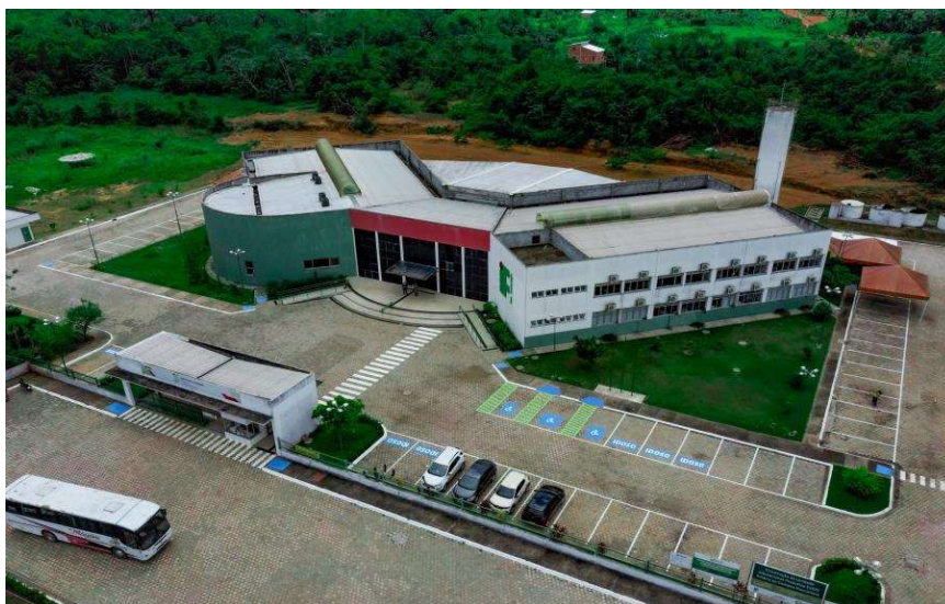
Vista área do Campus

O Campus Itacoatiara encontra-se localizado na estrada AM 010 à 08 KM de distância da cidade. Por conta da distância, o campus oferece transporte para os alunos.