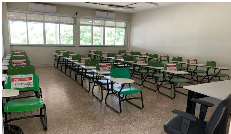
Um das salas que serão cedidas ao projeto, mas ambas medem 6m x 8m cada.