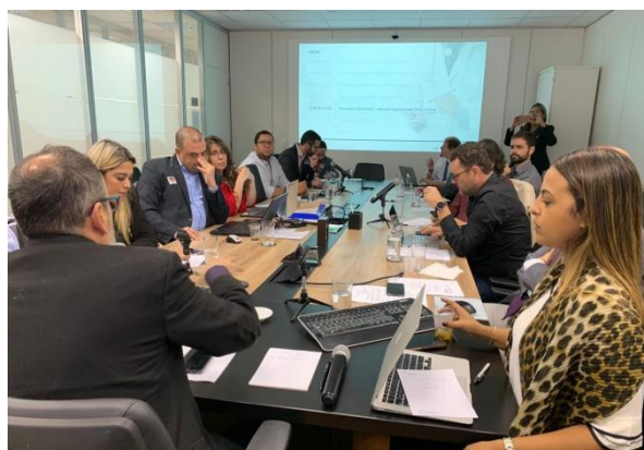
FIGURA 5 Reunião do CGESD aborda temas relevantes para a Estratégia de Saúde Digital para o Brasil.