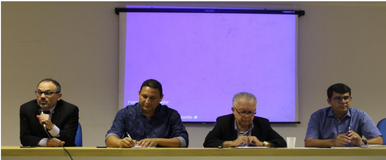
FIGURA 2 Reunião da CIR com as duas macrorregiões (Arapiraca e Maceió) do estado de Alagoas, com a presença de gestores municipais, SESAU, COSEMS e MS.

Na reunião, identificou-se a necessidade de criação de uma Força Tarefa conjunta entre todos os atores, para a implantação do projeto junto aos estabelecimentos de saúde e, principalmente, buscar o engajamento dos gestores municipais. Para executar estas atividades, essenciais para o sucesso do Conecte SUS, os seguintes passos foram definidos: a) implantação da Informatização no início de março de 2020; b) formação de uma equipe multidisciplinar para acelerar a implantação do e-SUS/APS nos estabelecimentos de atenção primária; c) definição do cronograma de implantação; d) identificação do ponto focal de cada secretaria municipal de saúde; e) disponibilização de uma agenda virtual para que os gestores municipais possam agendar a implantação do PEC/e-SUS APS nas unidades.