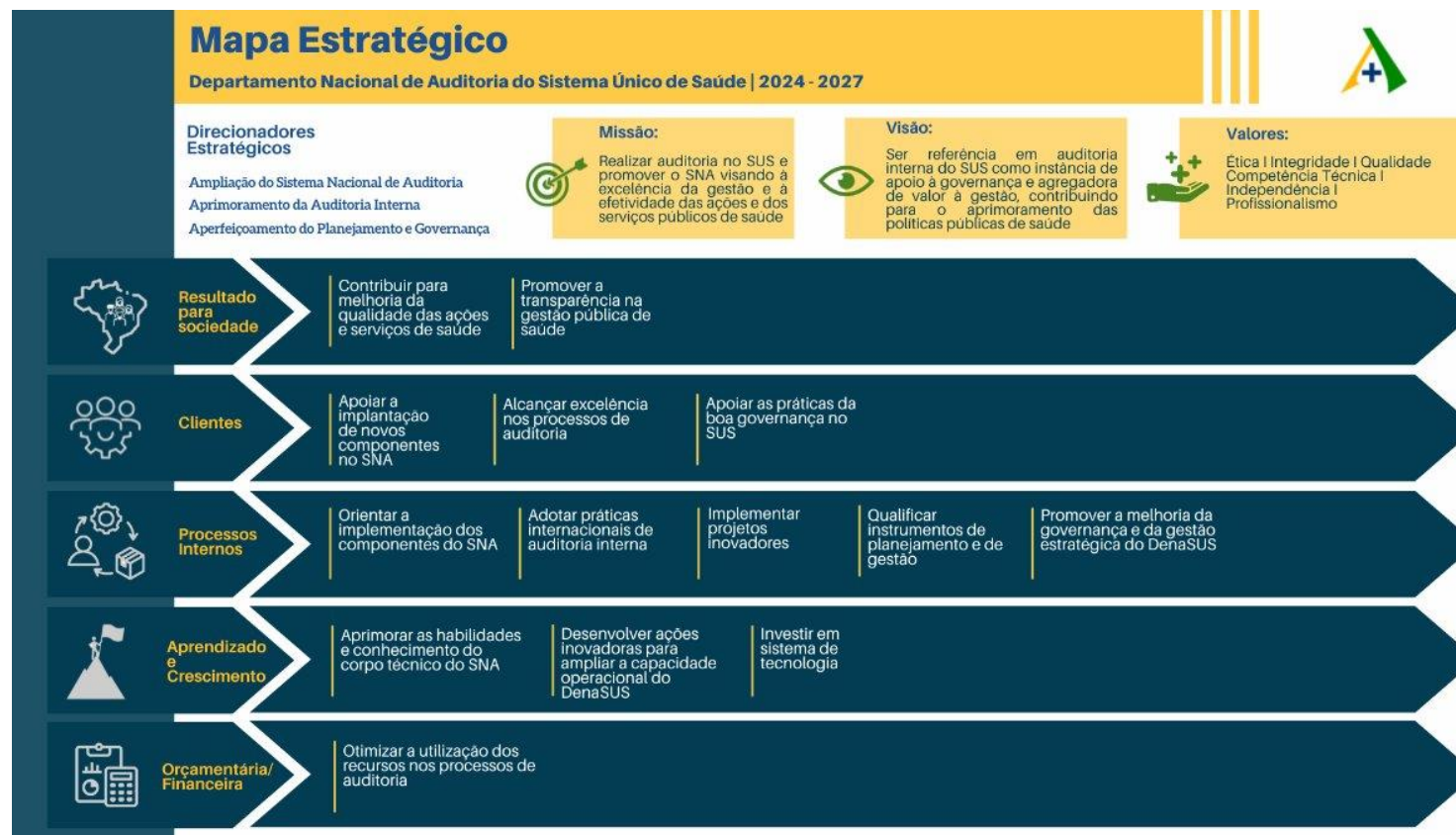
Figura II - Mapa estratégico 2024 - 2027

Fonte: Relatório Planejamento Estratégico 2024/2027.