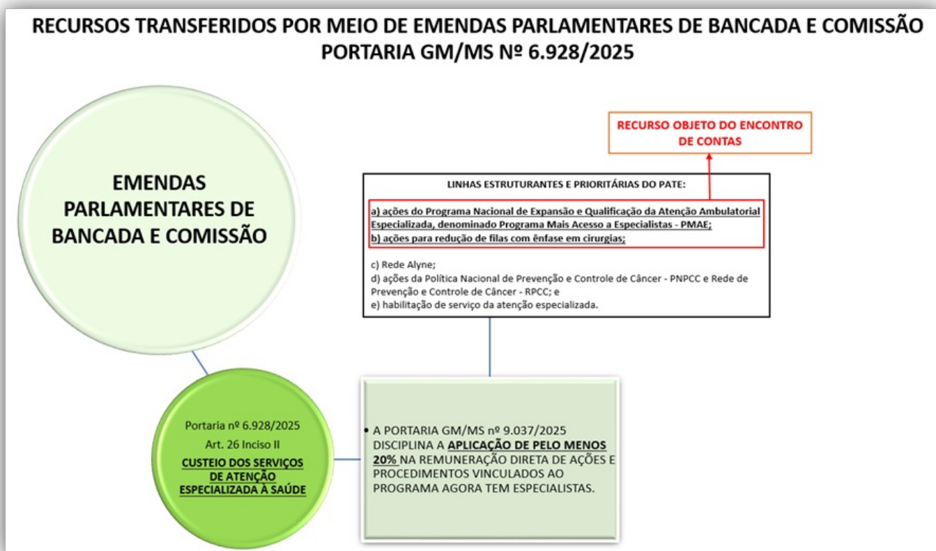
Figura 3: Regra para cálculo do valor de Emendas Parlamentares de Bancada e Comissão, destinado ao custeio direto dos componentes ambulatorial e cirúrgico, do Programa Agora Tem Especialistas, em 2025.