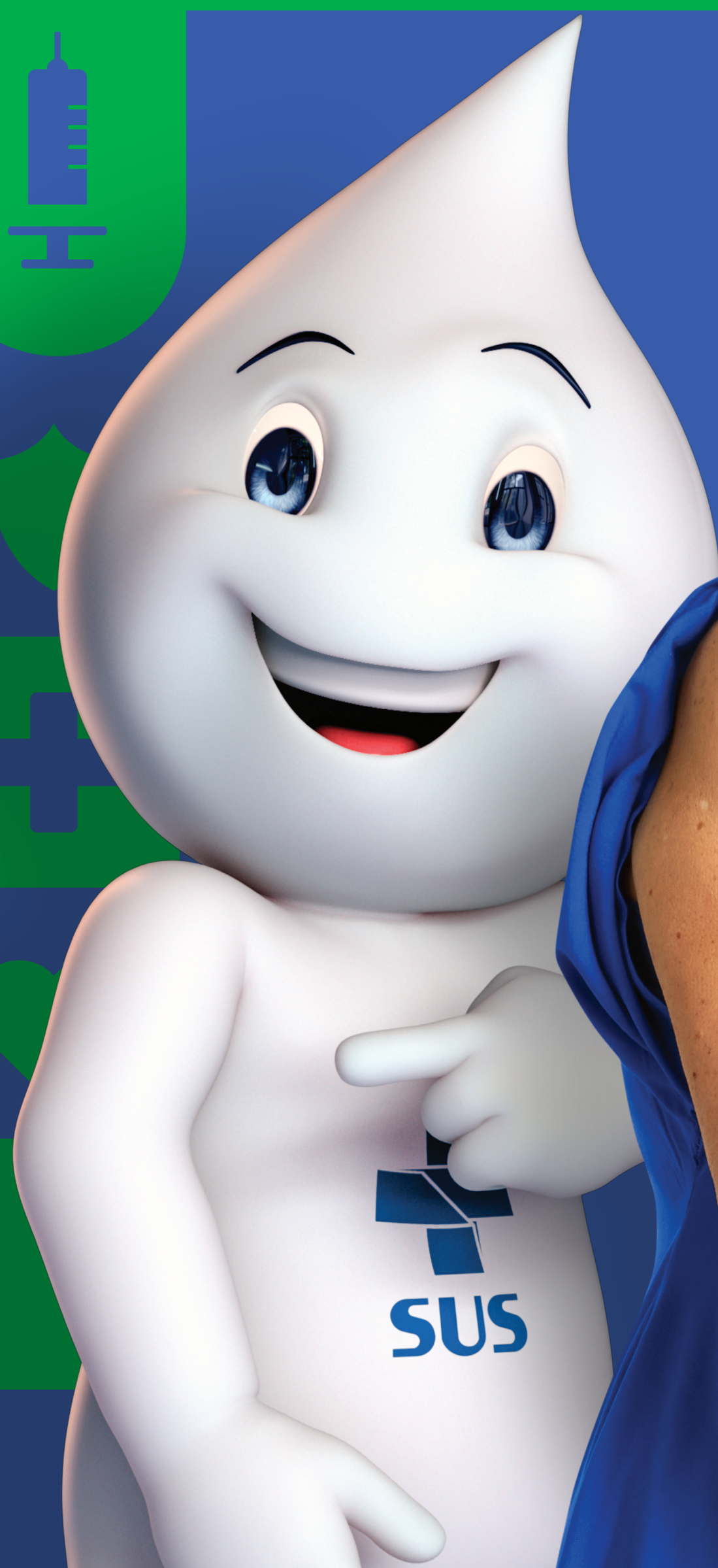
Nívea Maria Atriz