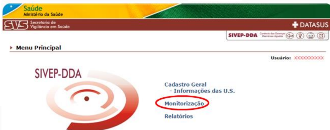
Figura 11. Tela de acesso a relatórios do Sivep-DDA.

➔ Selecione a “UF”, “Regional”, “Município”, “Semana inicial”, “Semana final” e “Ano” referentes ao relatório que se deseja exportar e em seguida, selecione “Ok” (Figura 12).