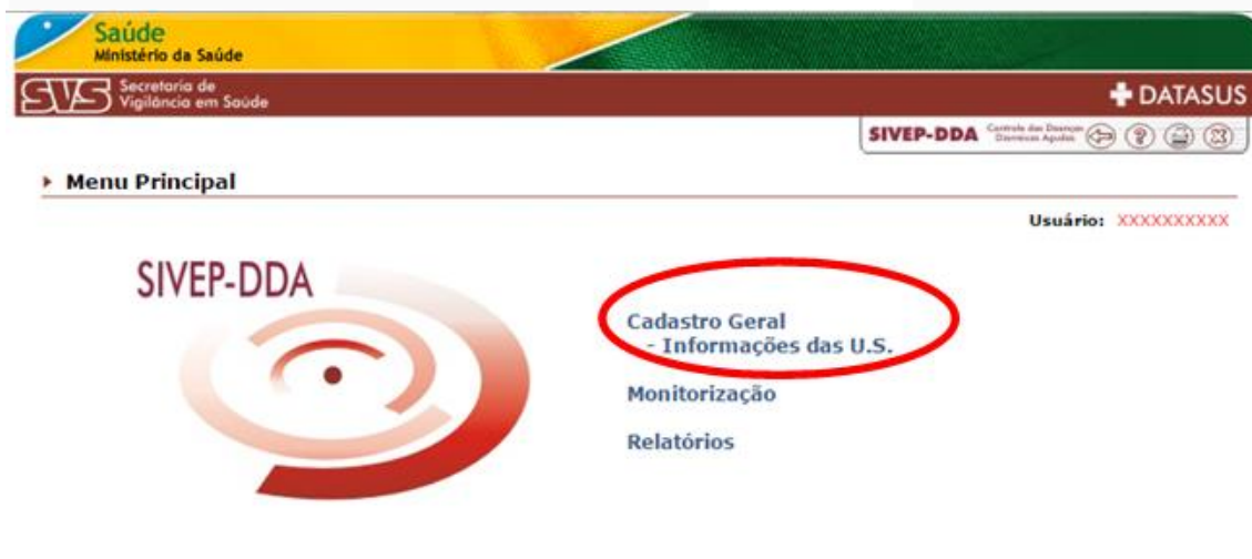
Figura 2. Tela de cadastro Geral.