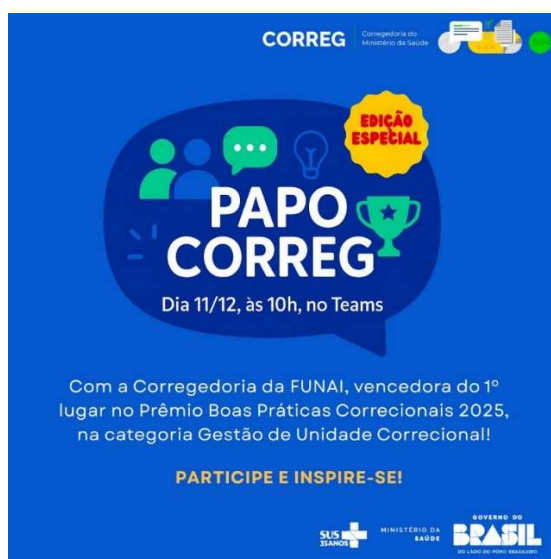
Figura 10: Convite para participação no “Papo Correg”, encaminhado à equipe.

A edição foi conduzida pela Corregedoria da Fundação Nacional dos Povos Indígenas, vencedora do Prêmio de Boas Práticas Correcionais 2025, com o projeto e-Prioridade, que utiliza tecnologia para modernizar e dar transparência aos processos internos, garantindo maior agilidade e efetividade nas apurações disciplinares.