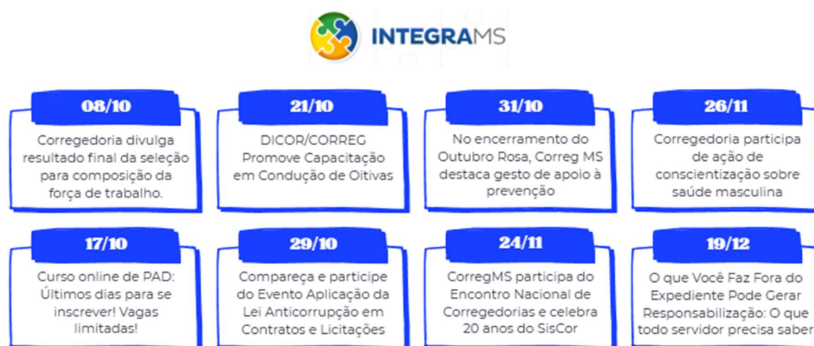
Figura 8: Notícias publicadas no IntegraMS no 4º trimestre de 2025.

Durante o quarto trimestre de 2025, foram publicadas oito matérias na intranet do Ministério da Saúde (IntegraMS), com destaque para iniciativas de capacitação, prevenção a irregularidades disciplinares, promoção da saúde e participação em eventos estratégicos.