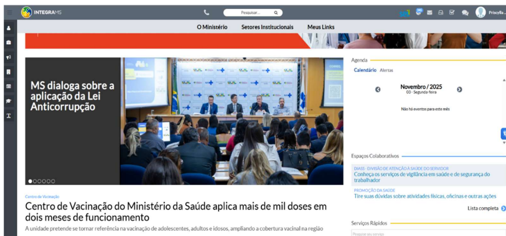
Figura 6: Destaque do evento “Aplicação da Lei Anticorrupção em Contratos e Licitações”, no IntegraMS.

O conteúdo completo do evento está disponível no YouTube por meio do link https://www.youtube.com/watch?v=rWBzvosR3Zc .