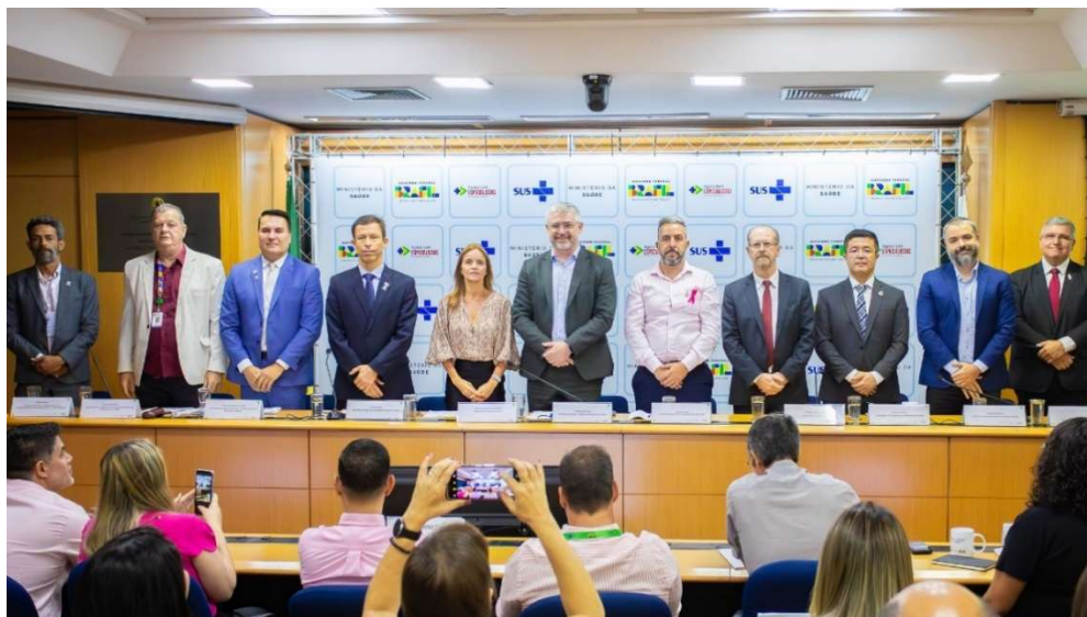
Figura 5: Mesa de abertura da 1ª Oficina de Planejamento Sistematizado de Contratações Públicas