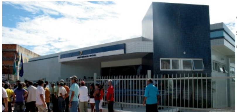
Agência da Previdência Social em Tucuruí, no Pará, recém-inaugurada

Para a instalação das novas agências, o INSS conta com a parceria dos municípios. Já foram indicados 588 terrenos, dos 720 previstos. Desse total, 243 lotes já estão com lei de doação aprovada pelos legislativos locais, 189 com escritura lavrada, 117 já foram vistoriados pela engenharia do INSS e 13 estão com projeto de