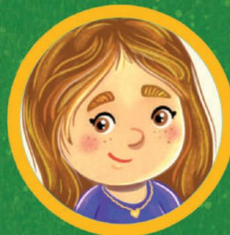
ILUSTRADO POR LUANA CHINAGLIA