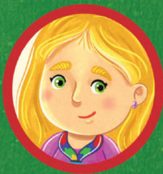
ESCRITO POR ALINE CAMPOS