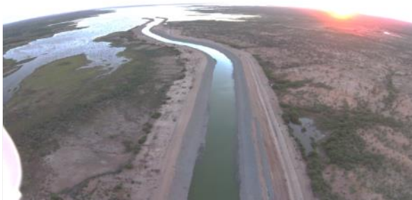
PISF – Captação Eixo Leste