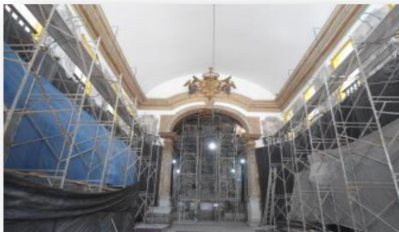
Restauração da Igreja Matriz de N. S. da Conceição – Ouro Preto/MG