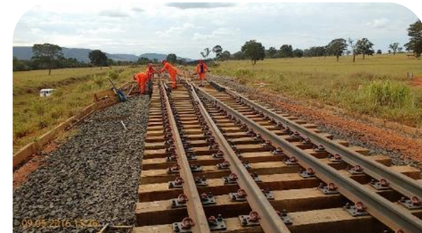
Ferrovias Norte-Sul – Extensão Sul/GO