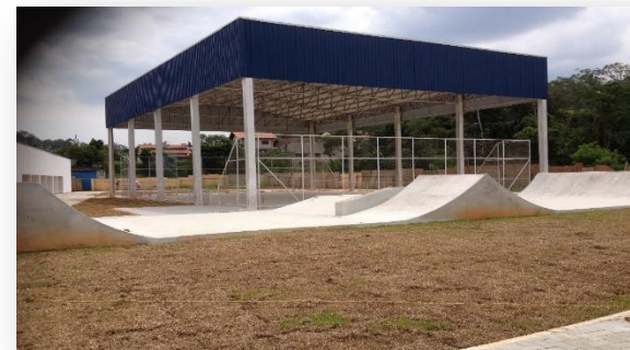
Centro de Artes e Esportes Unificados – Modelo 3.000m² Ribeirão Pires/SP