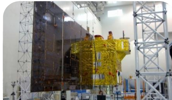
1º Satélite Brasileiro