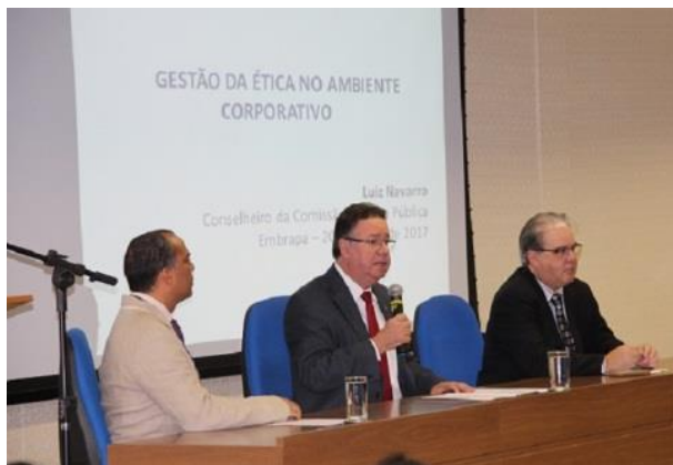
Abertura: Diretoria Executiva