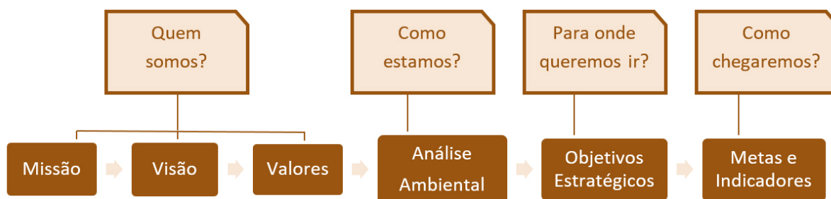
Figura2: Visão geral da elaboração do PETIC/PR

Com fundamento nos conceitos de BSC, o GT-PETIC elaborou o PETIC/PR de acordo com as seguintes fases: