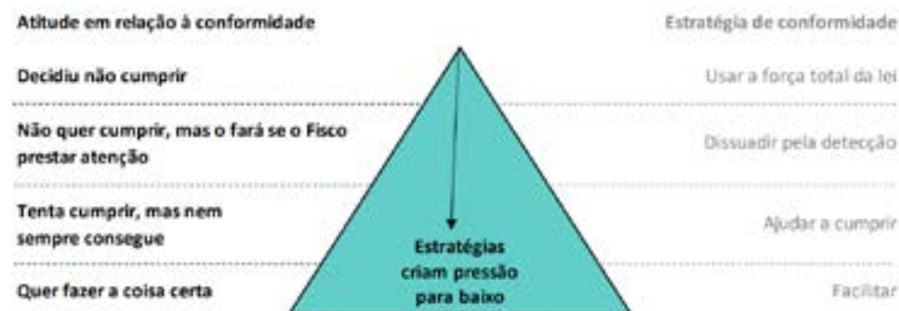
Figura 01- Modelo de Conformidade da OCDE

Tendo o contribuinte a iniciativa e a centralidade na Declaração de Compensação, é aplicável neste caso o consagrado modelo de conformidade utilizado pela Administração Tributária Australiana, doravante denominado “Pirâmide de Conformidade”: