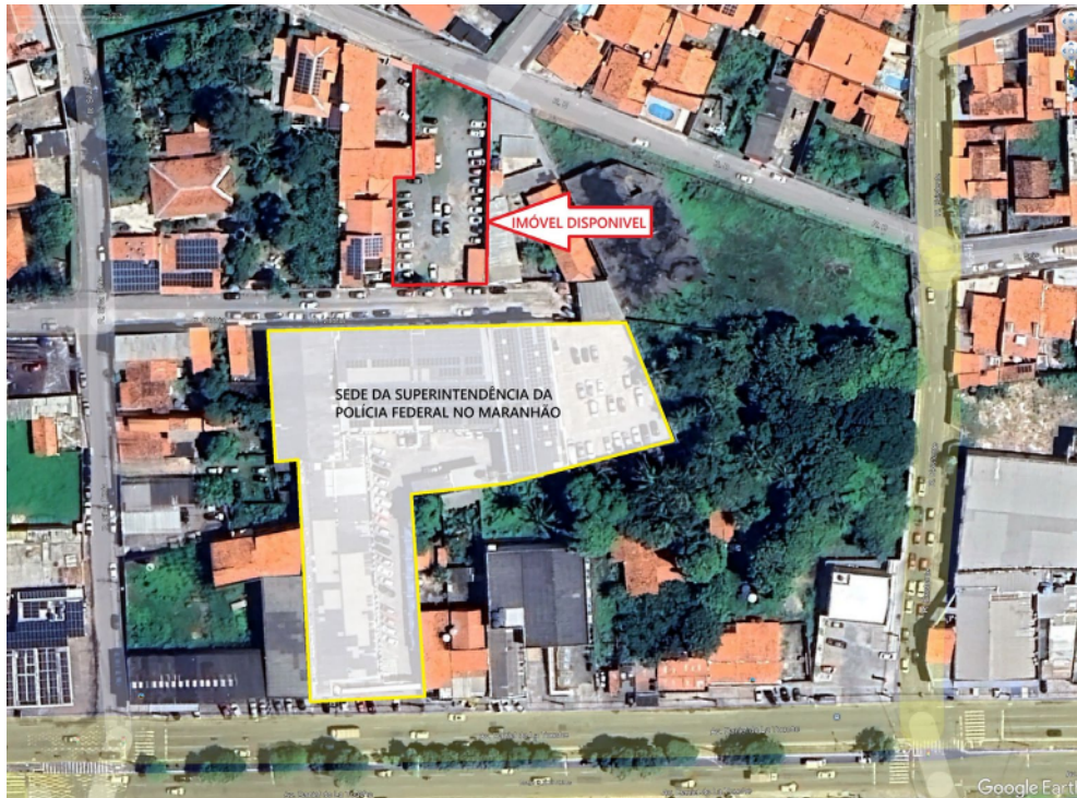
Imagem aérea do imóvel disponível para sublocação e da atual sede da PF/MA.